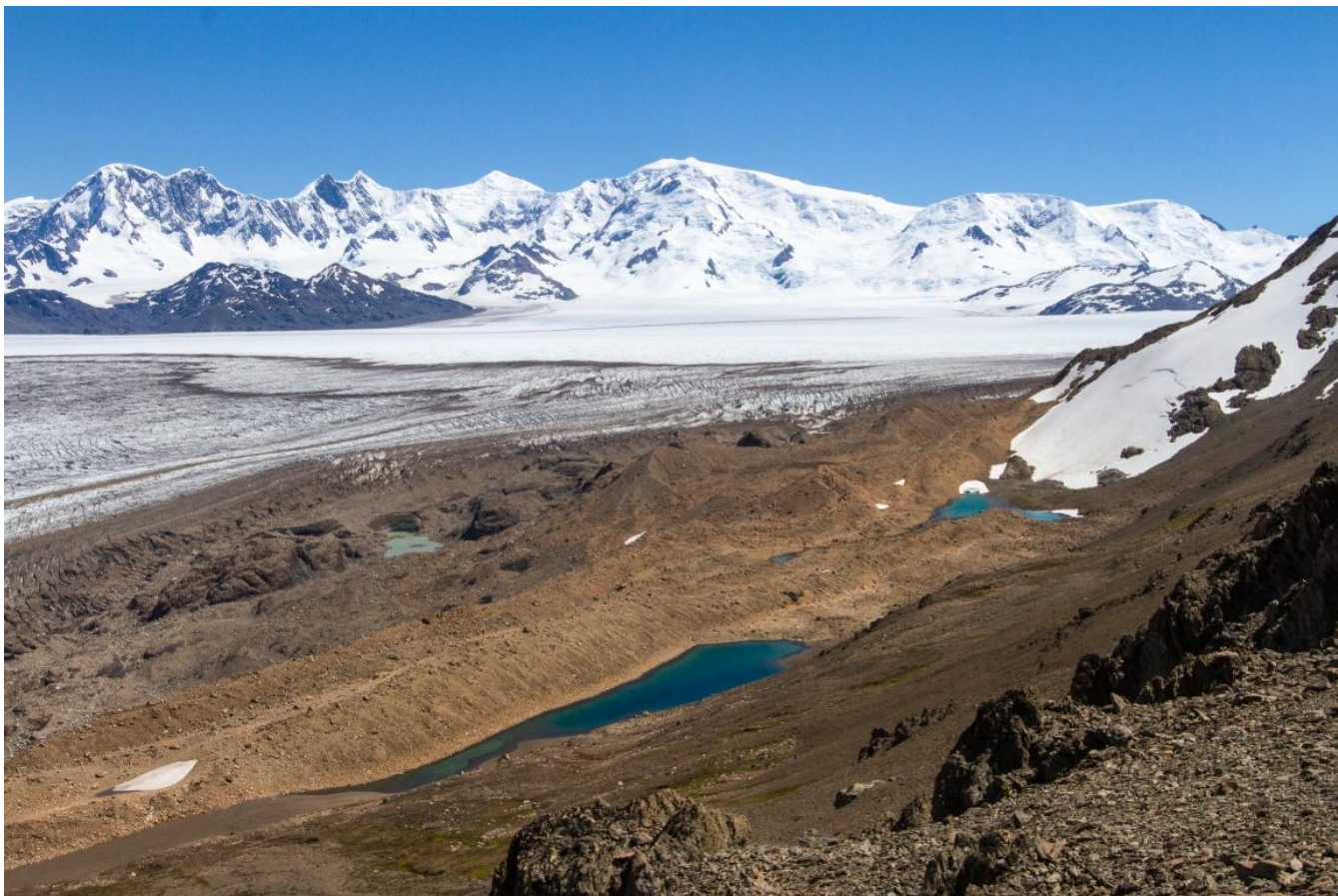
Рис.5. Западный склон перевала. Вид на северо-запад в сторону ледовых полей.