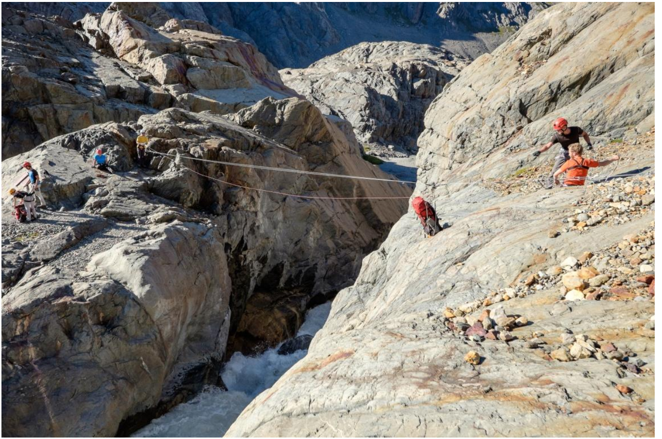
Рис. 7. Навесная переправа при подходе к перевалу Paso del Viento