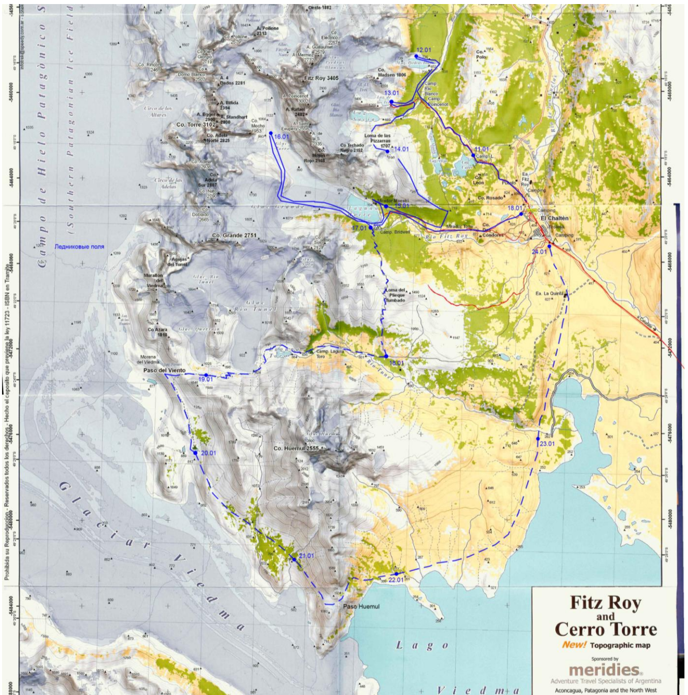
Рис. 1. Обзорная карта района. Пунктирной линией показан Хуелму трек.