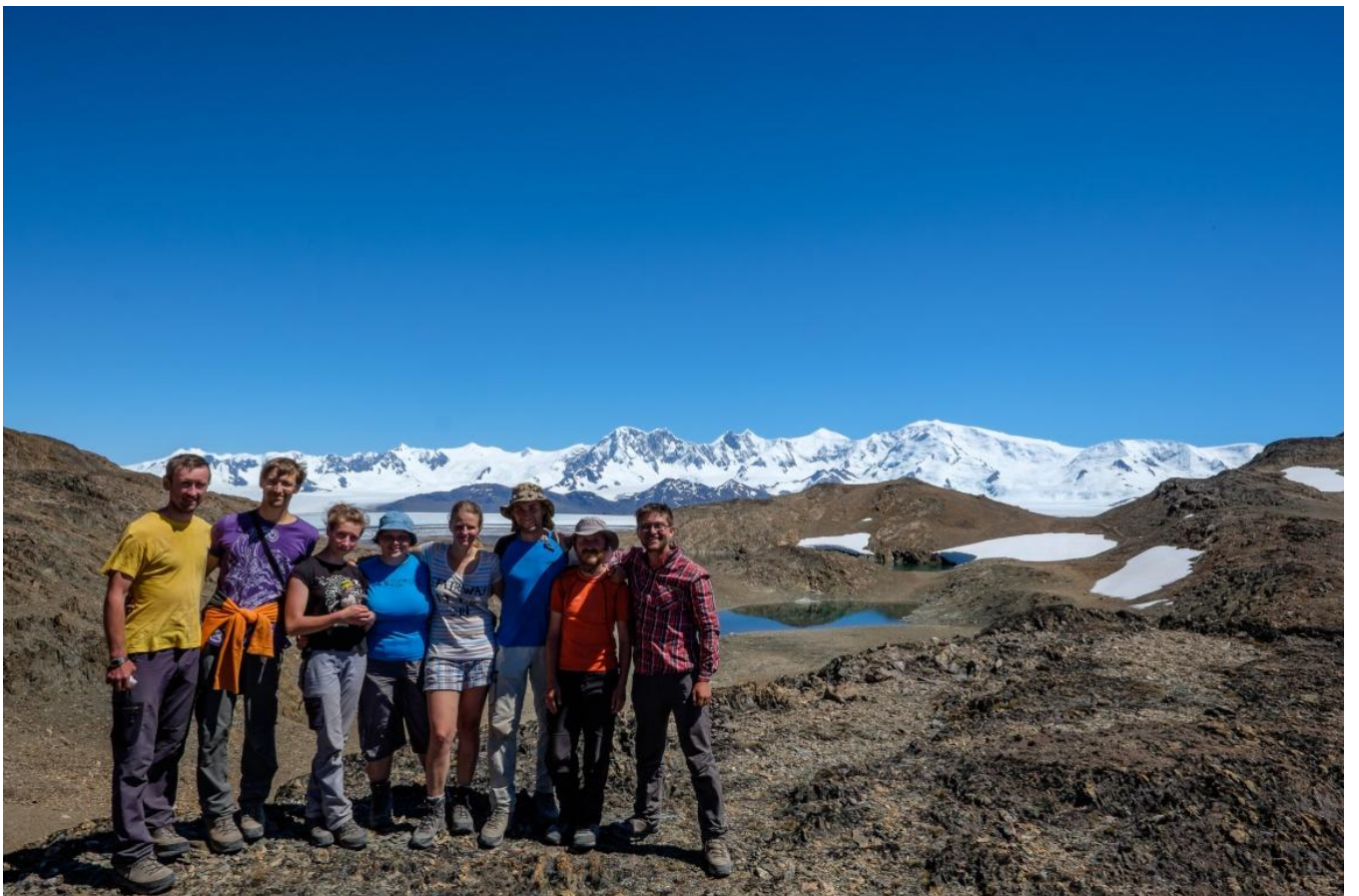
Рис. 4. Седловина перевала. Видны озера на седловине.