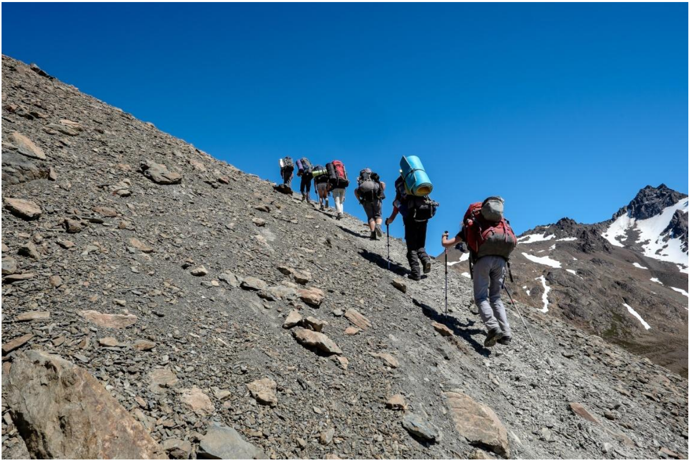
Рис. 3. Подъем к седловине перевала