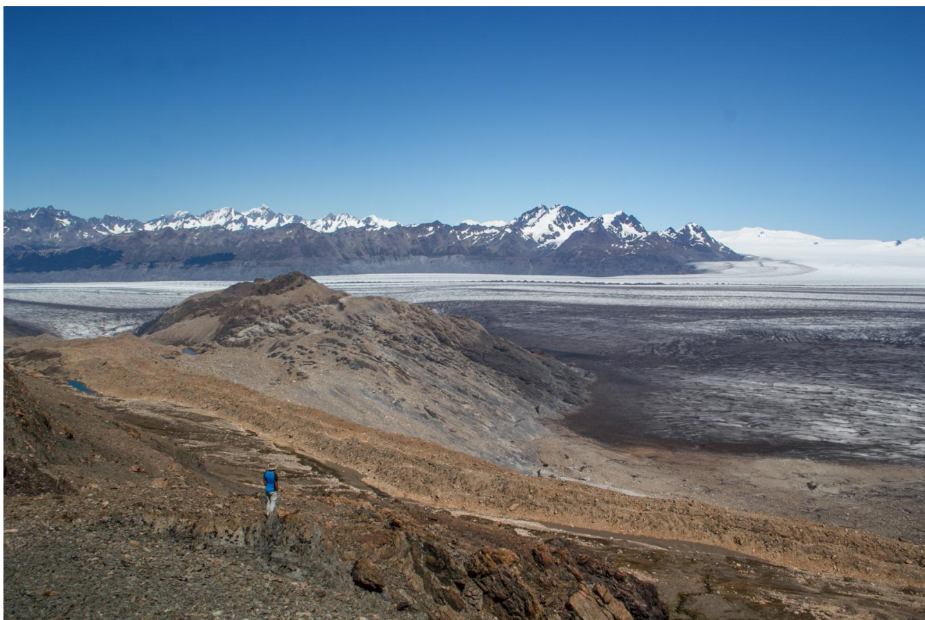
Рис. 6. Спуск с перевала. Вид на юго-запад.