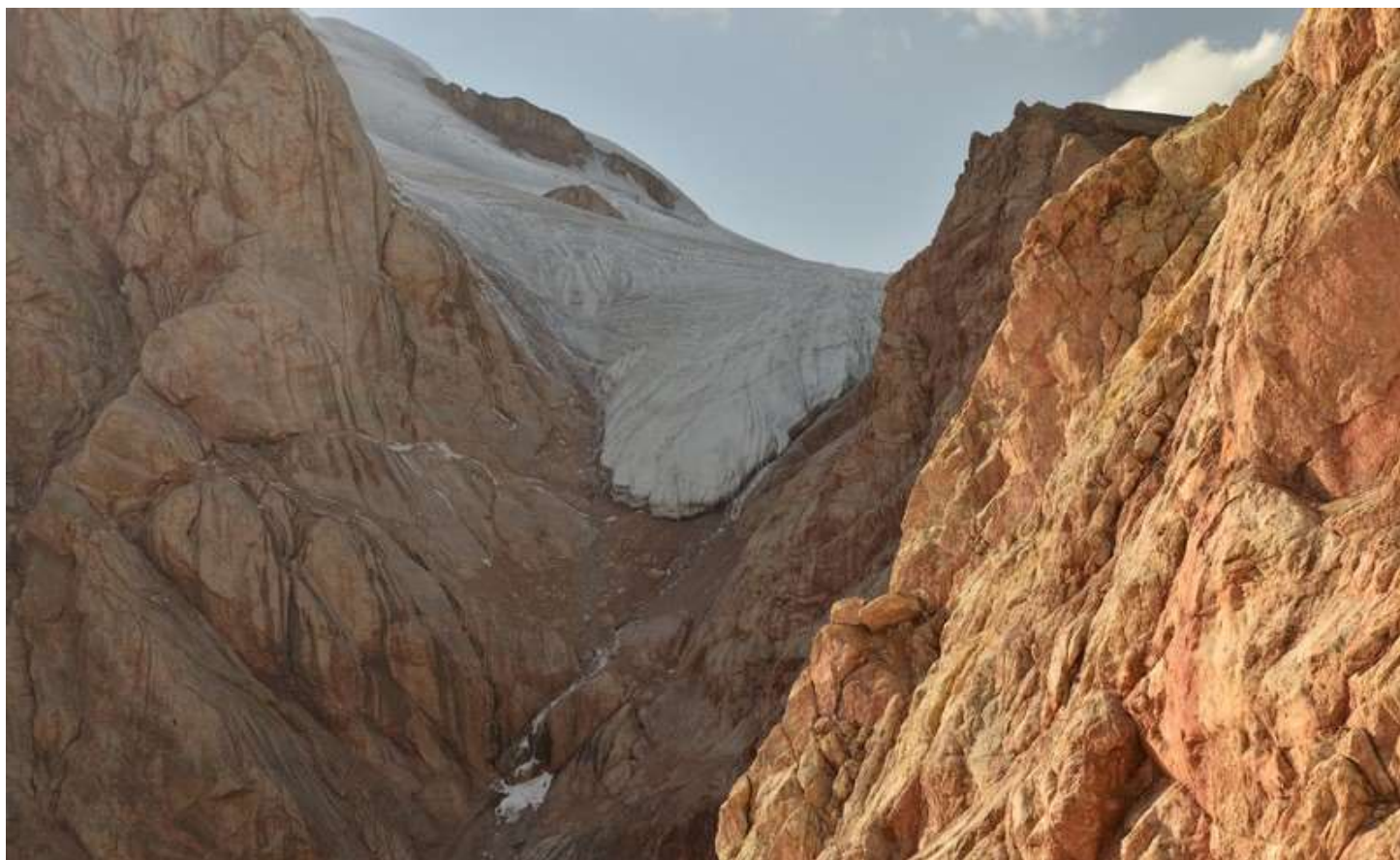
Рисунок 97 - Язык ледника, свисающий под в.4597 в сторону пер.Траверсный