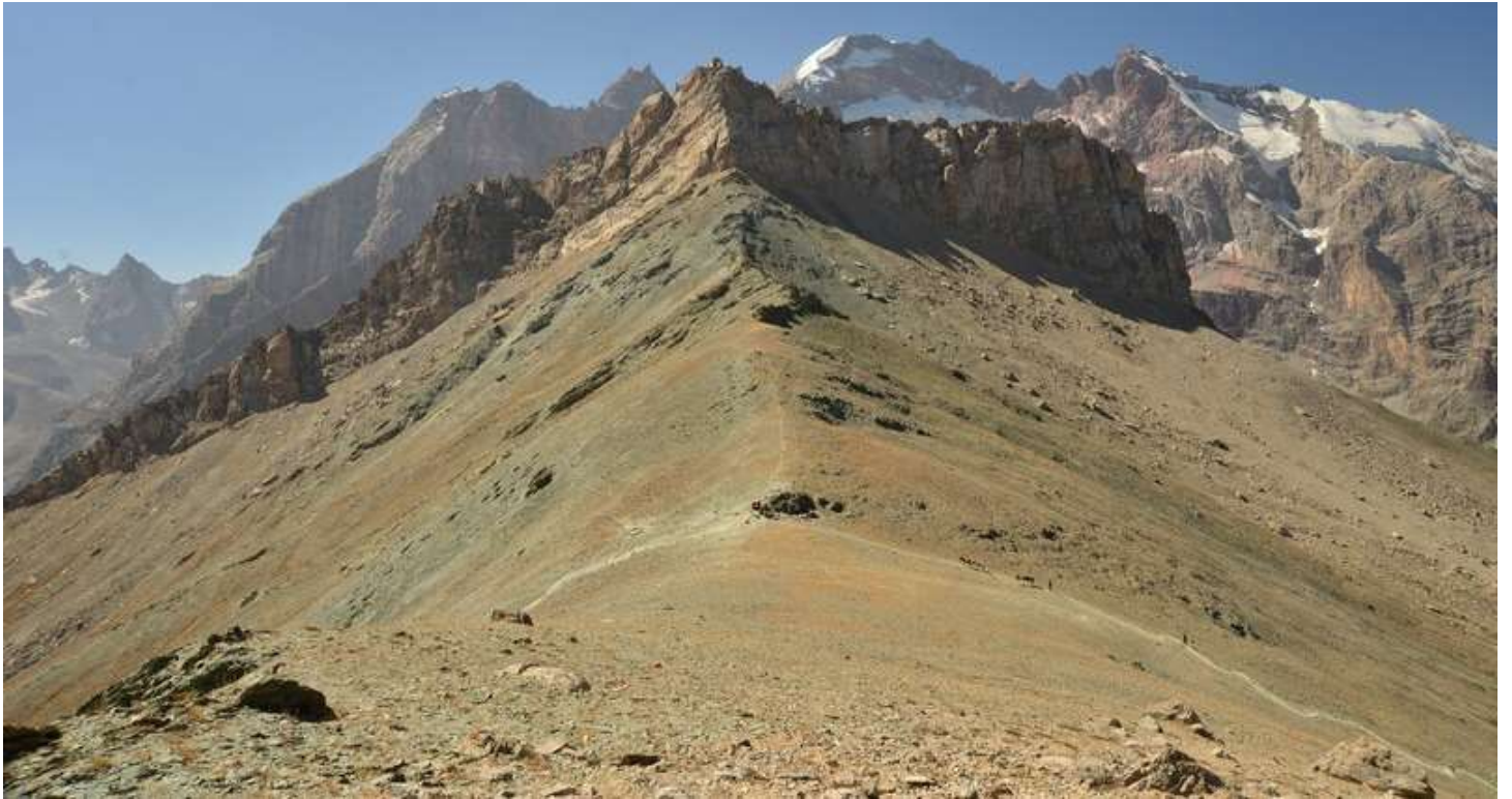
Рисунок 13 - Седловина пер. Алаудинский