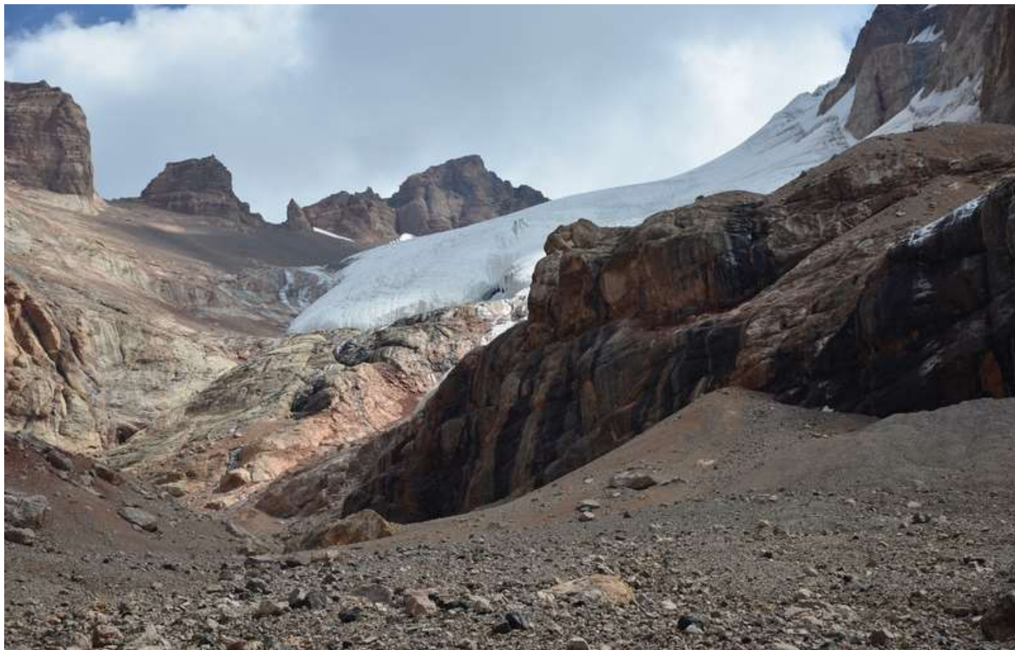
Рисунок 55 - Общий вид бараньих лбов