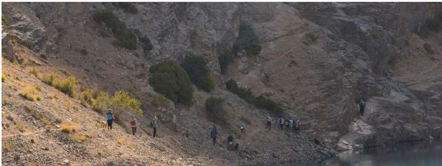
Рисунок 47 - Те самые скальные плиты, которые порой уходят под воды Б.Алло, о которых пишут "в случае непогоды требуют провески перил". На наших глазах товарищ из коммерческой группы окупнулся, чем вызвал у нас непреодолимое желание погрузиться в озеро используя скалы как трамплин