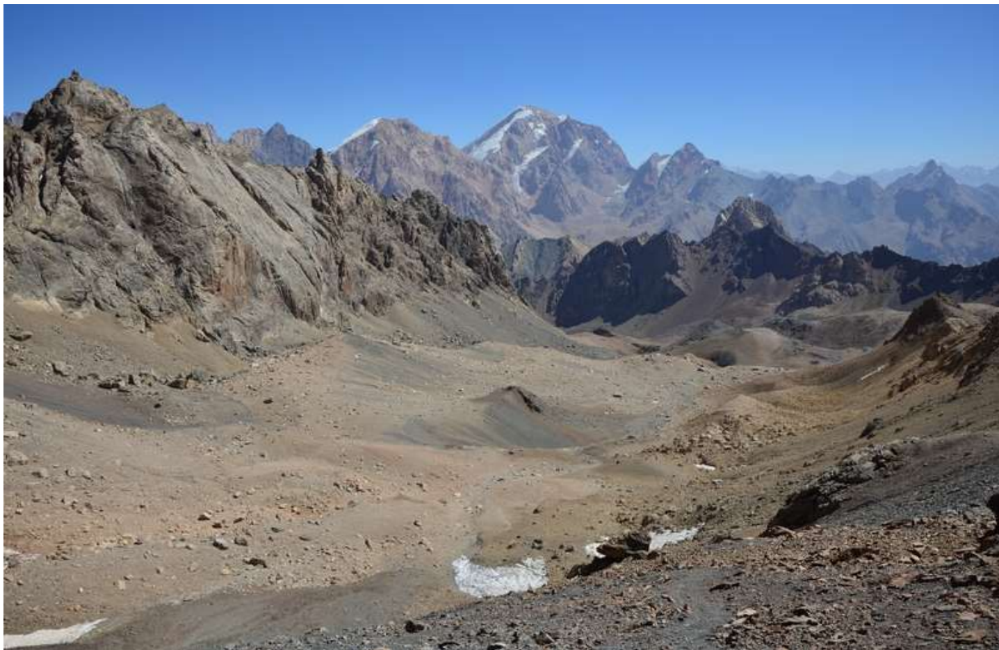
Рисунок 41 - Вид на восток с перевала