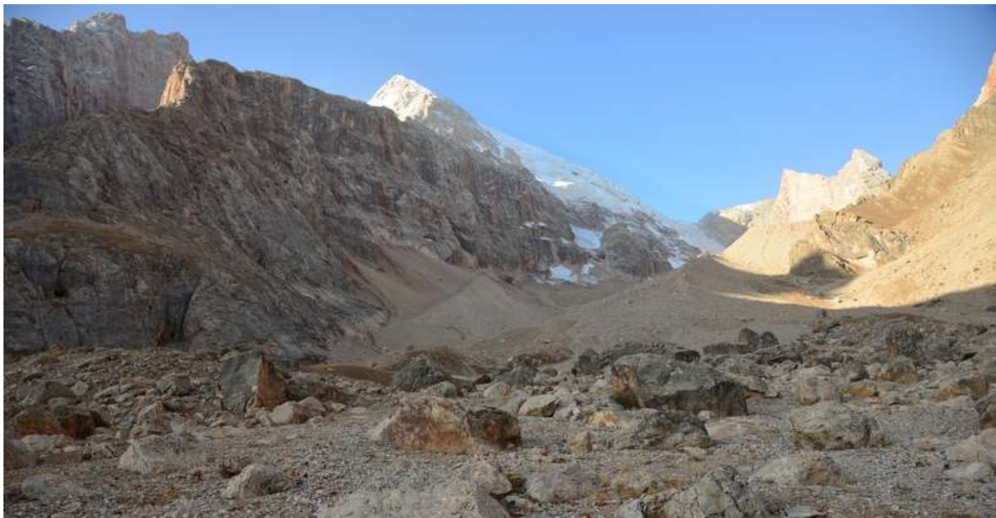
Рисунок 111 - В районе Райских стоянок

Выходя с райских стоянок надо брать сильно левее, дабы выйти на чуть более удобный склон. После каньона выход на очередную хорошо набитую тропу и Фанский кайф до самой стрелки рек Пасрударья и Имат.