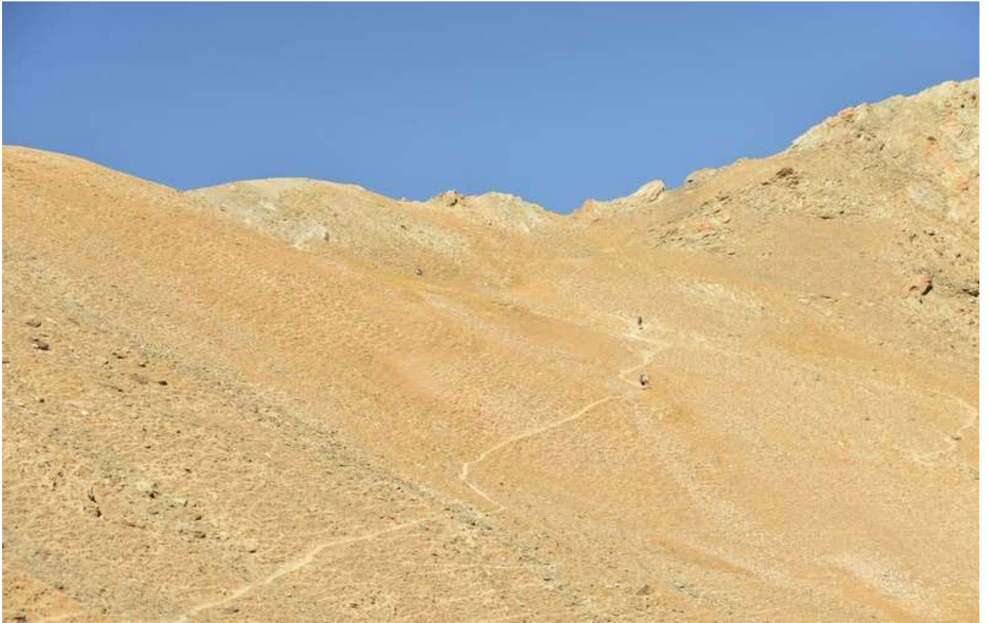
Рисунок 5 - Подъем на пер.Лаудан