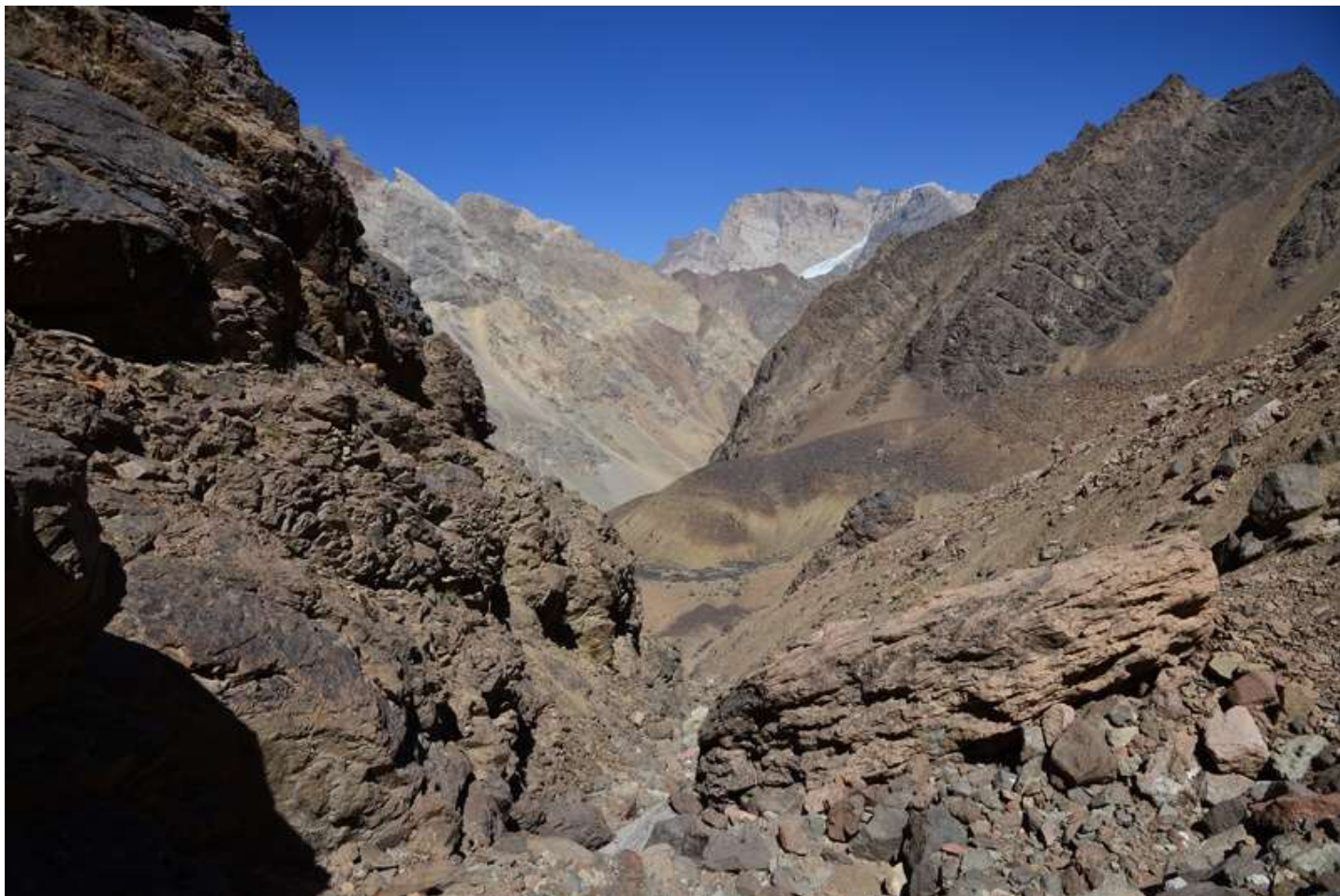
Рисунок 37 - В пересохшем русле