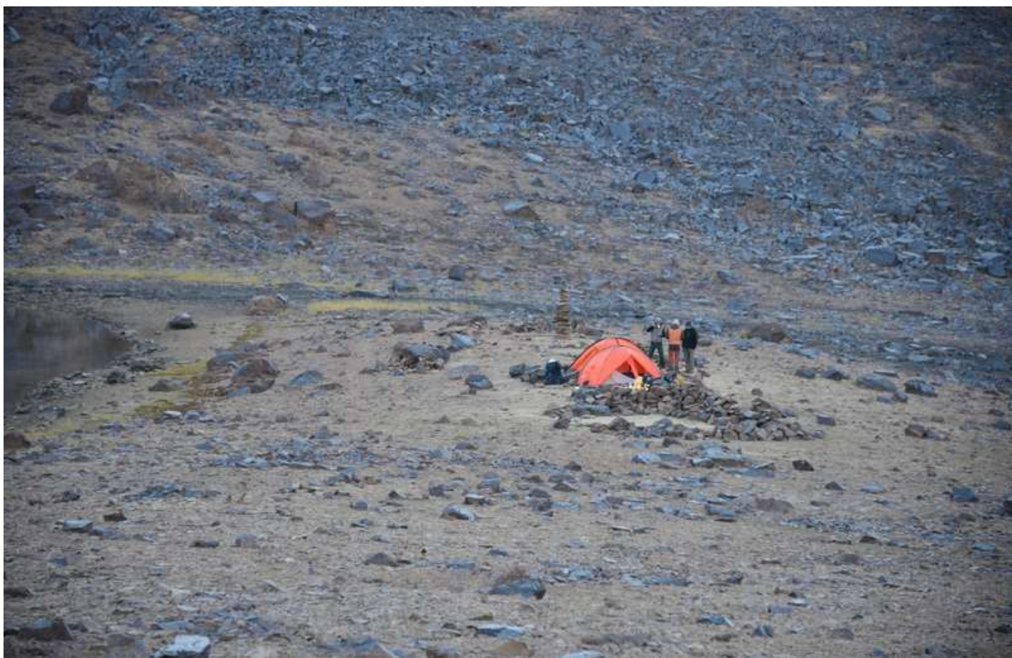
Рисунок 38 - На берегах оз. Бирюзовое