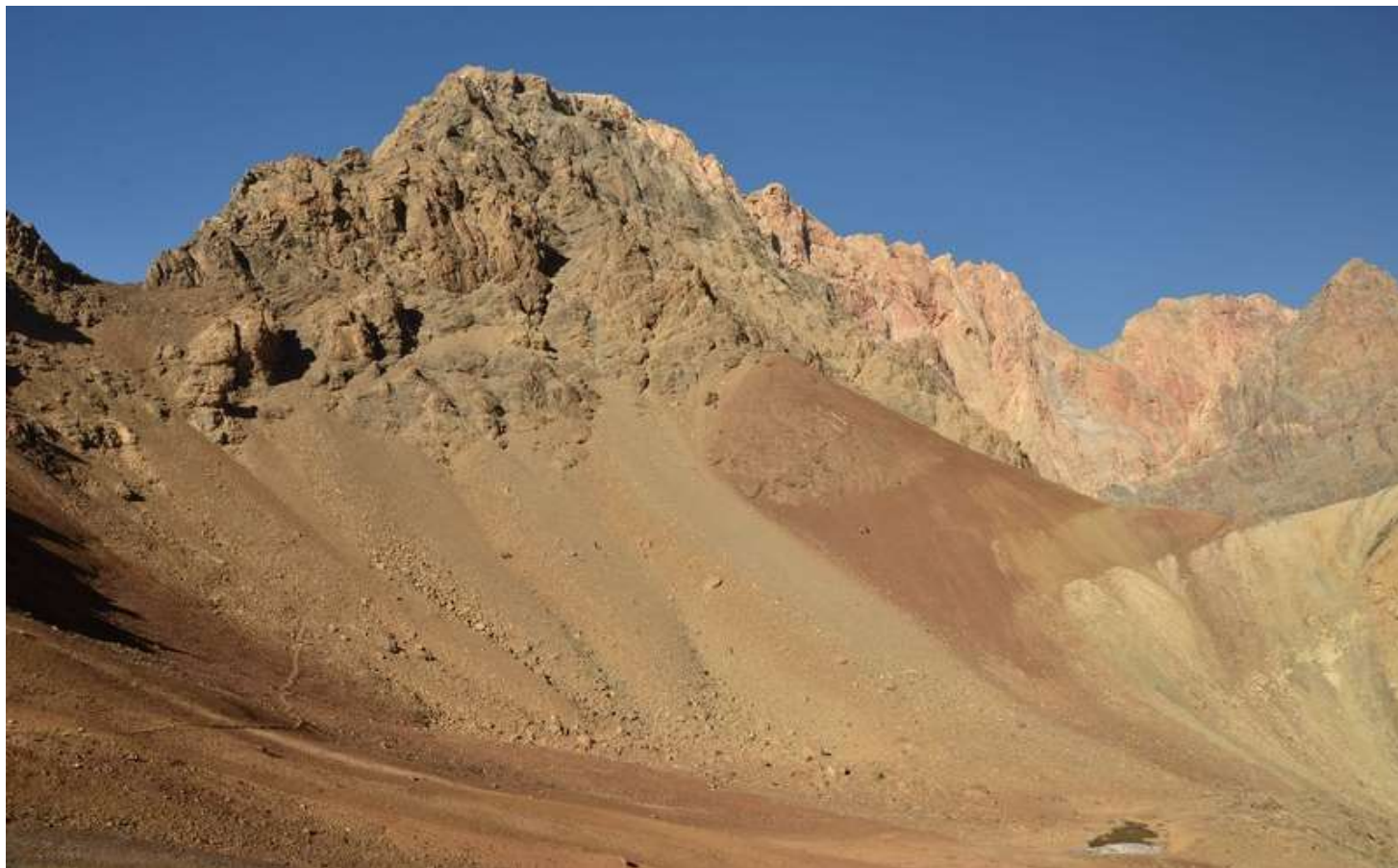
Рисунок 81 - Траверс с пер.6868 к пер.6867. и вид на пер.Яшмовый В