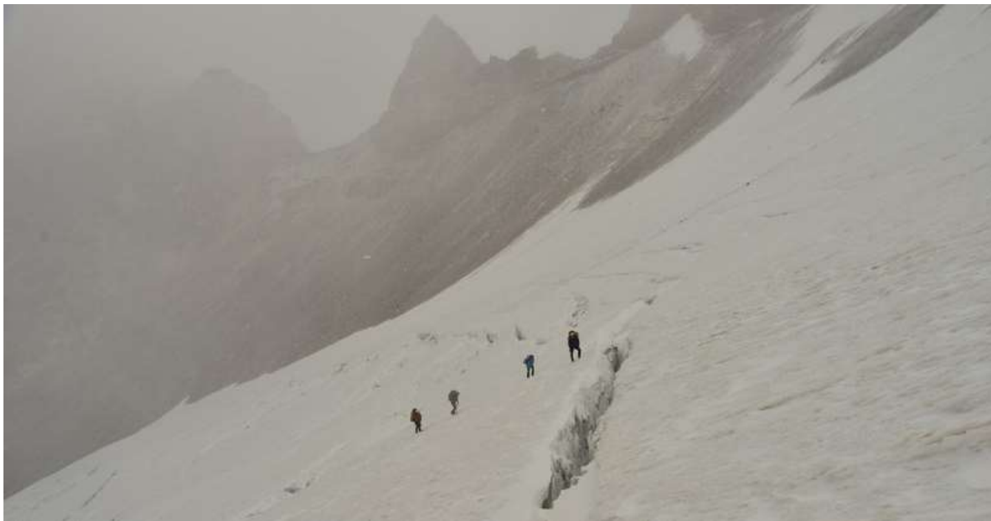
Рисунок 59 - верховья ледника Курумоч, пологая часть