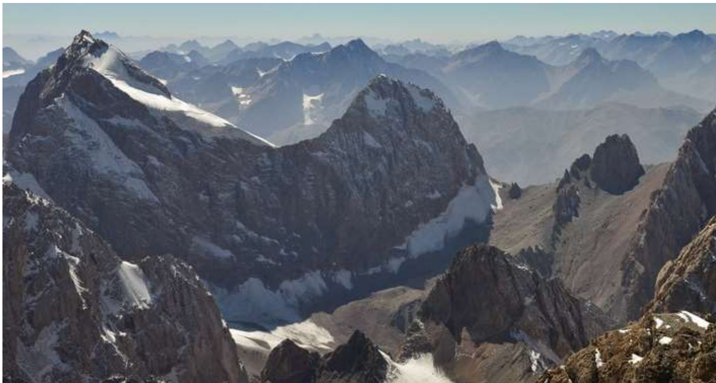
Рисунок 67 - Перевалы Амшут с Энергии