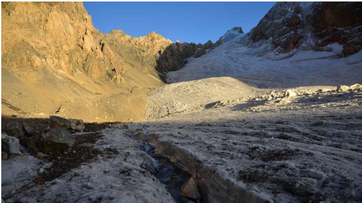
Рисунок 85 - Вид на л.М.ганза с стоянок на морене