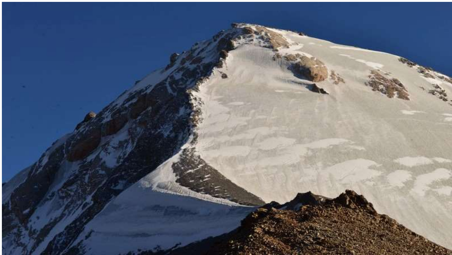
Рисунок 73 - Общий путь восхождения