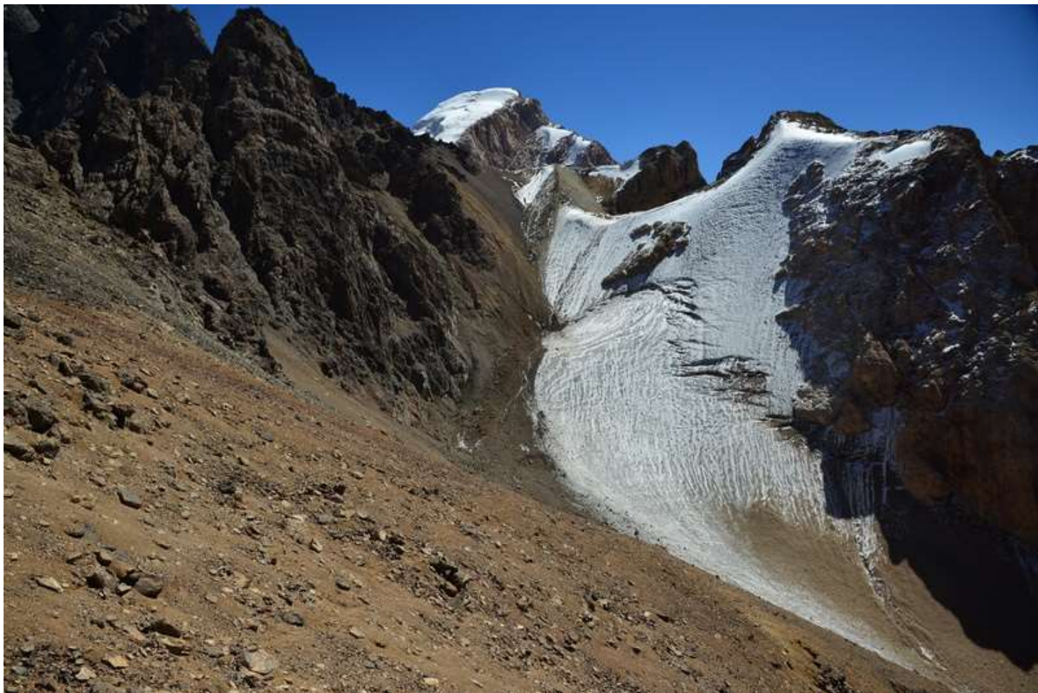
Рисунок 79 - Южный склон пер.ВАА и вид на западный склон пер.6868, там где ссыпались камни