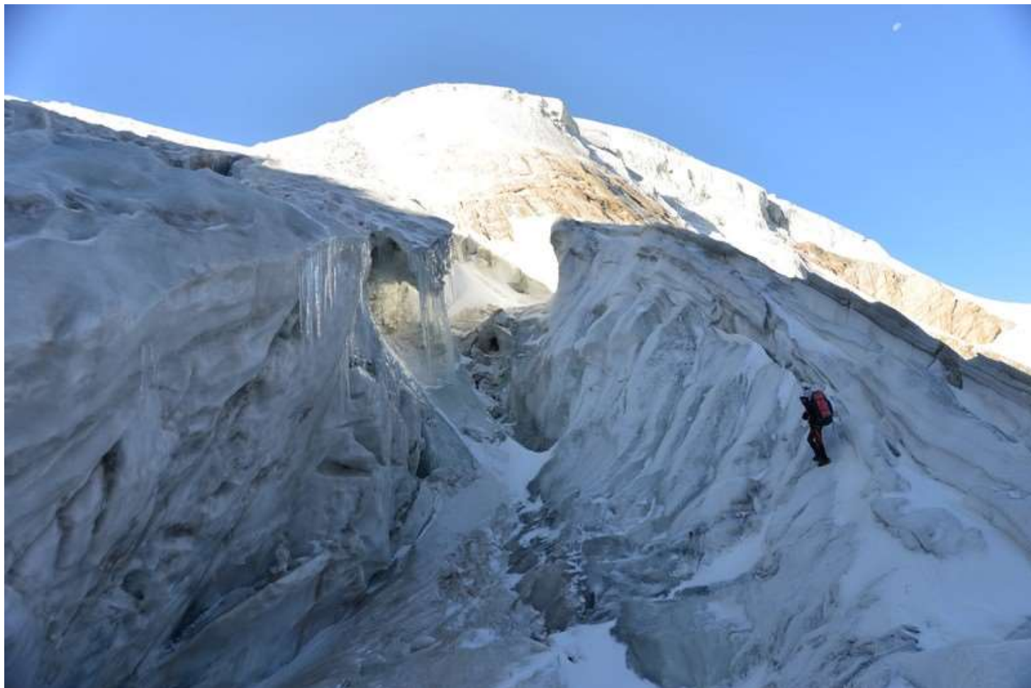
Рисунок 87 - В ледопаде л.М.Ганза