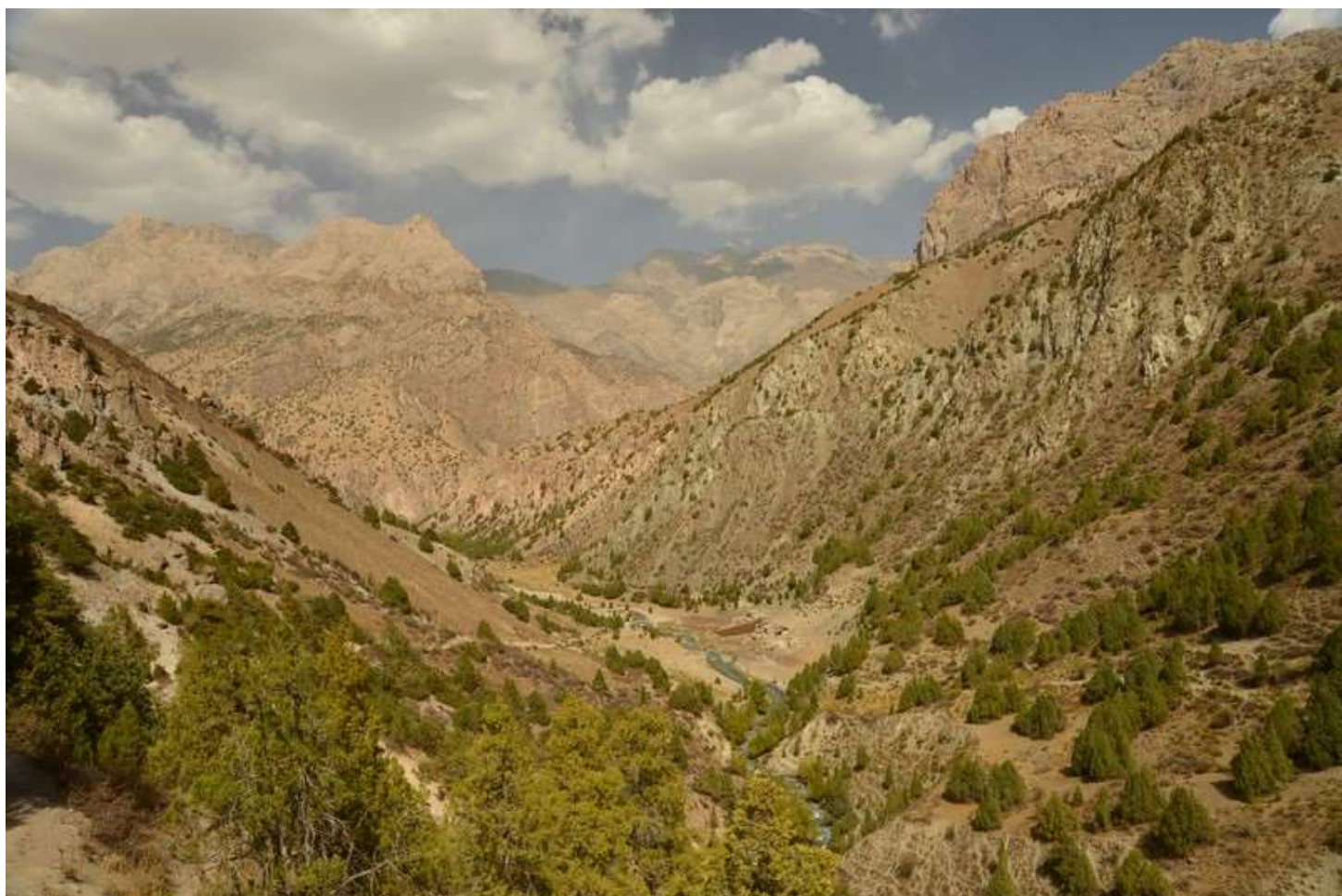
Рисунок 114 - На подходе к стрелке рек Имат и Пасрударья