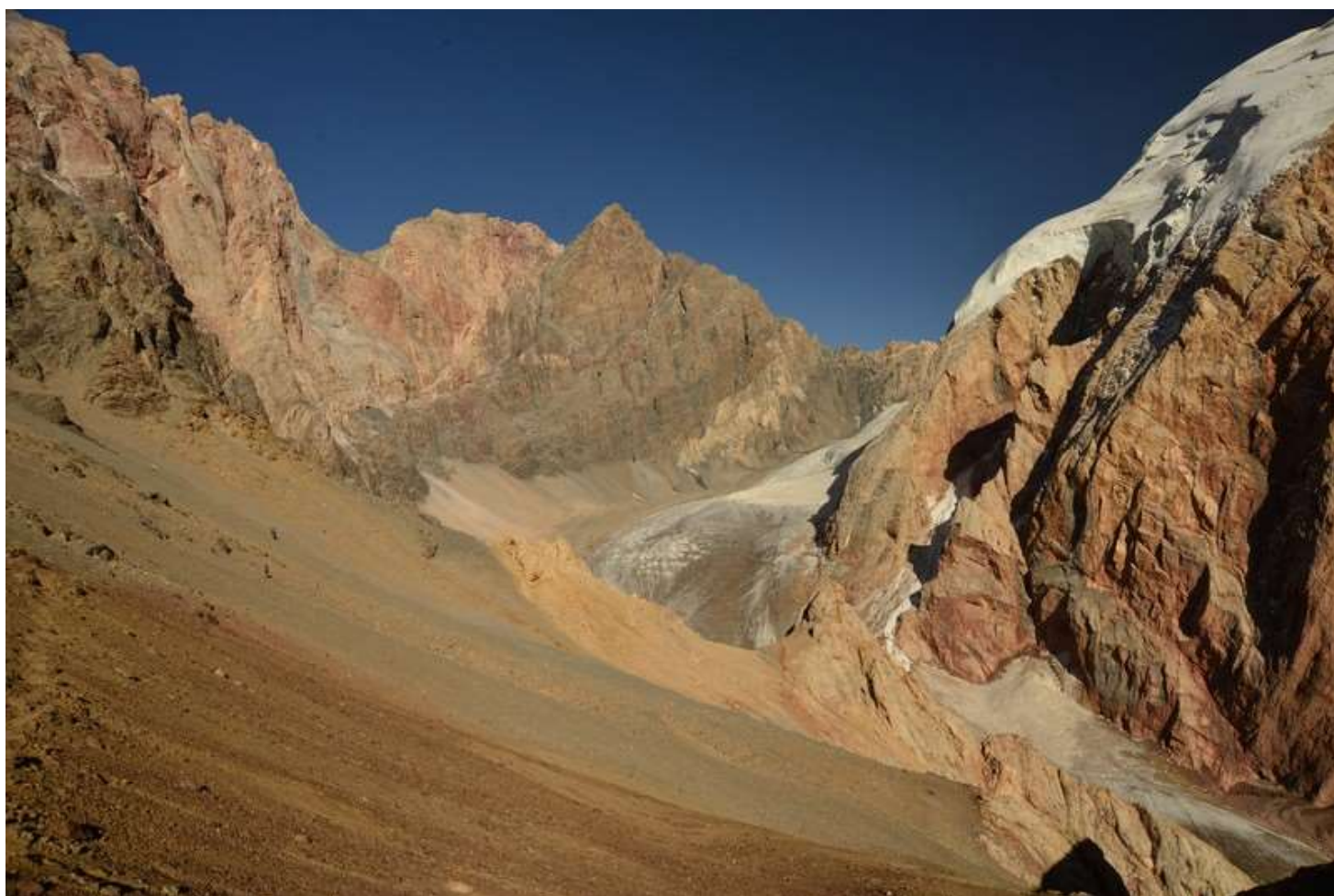
Рисунок 82 - Траверс с пер.6867 к пер.6866 и вид на пер. Кентавр