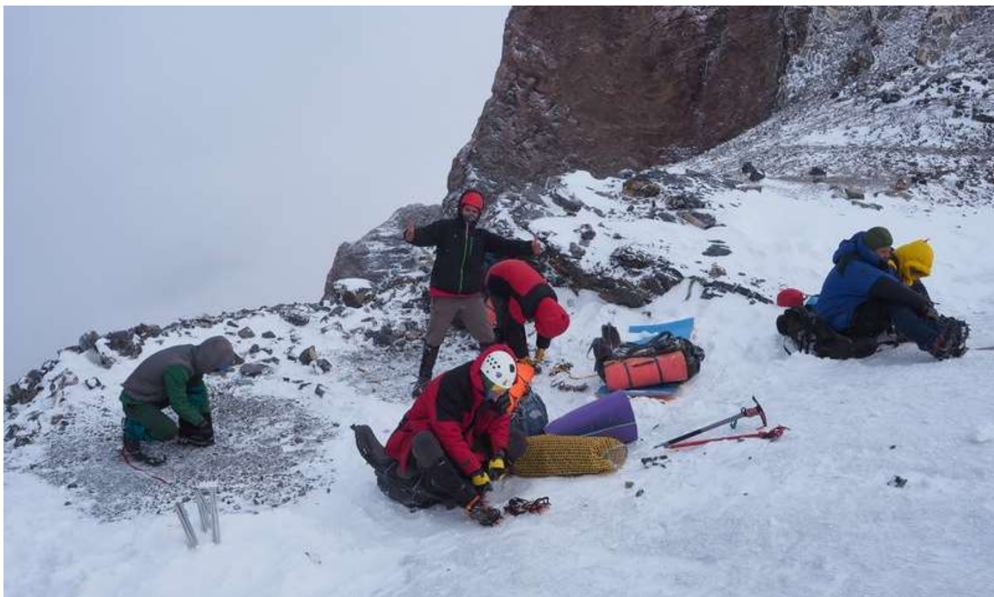
Рисунок 60 – Сбор лагеря на местах под палатки на пер.Мирали

Погоду так и не дождались, и, дабы не жертвовать остальной частью маршрута, было принято решение идти по запасному варианту маршрута. Как и предполагалось, по мере спуска погода все улучшалась, мы сидели в облаке, а к концу дня распогодилось совсем.