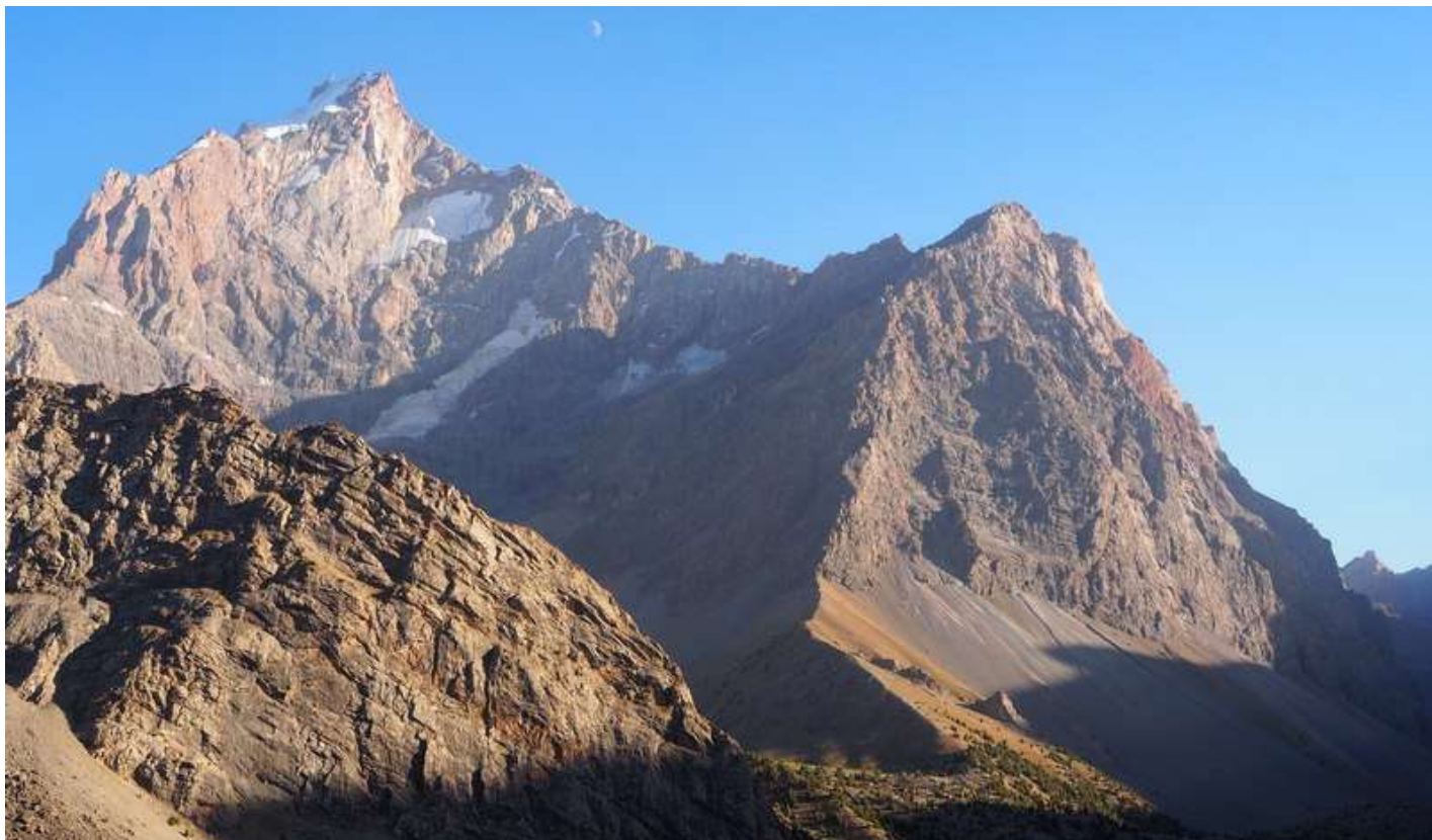
Рисунок 3 - Вид с м.н. на красавицу Чапдару