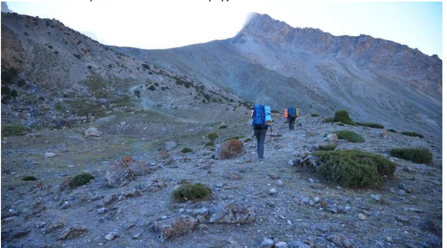
Рисунок 12 - Первые шаги к пер. Алаудинский