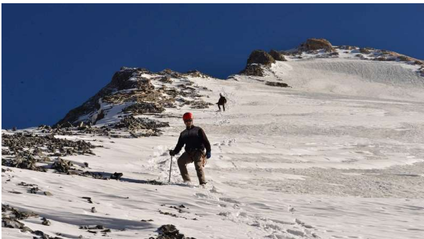
Рисунок 72 - Спуск с Энергии перед выходом на скалы