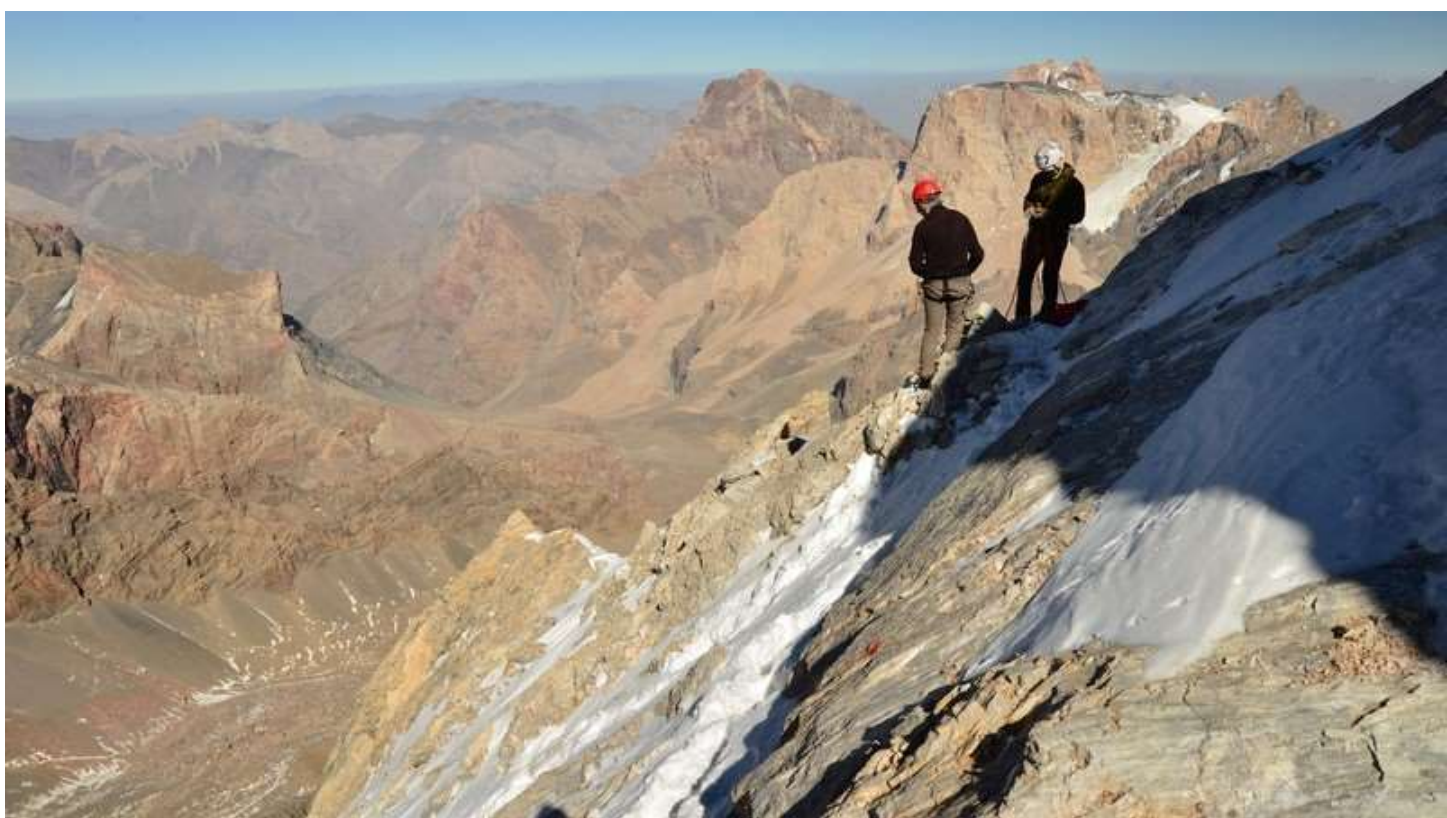
Рисунок 70 - На спуске с Энергии, первая провешенная нами веревка, другие вешали еще веревку выше.