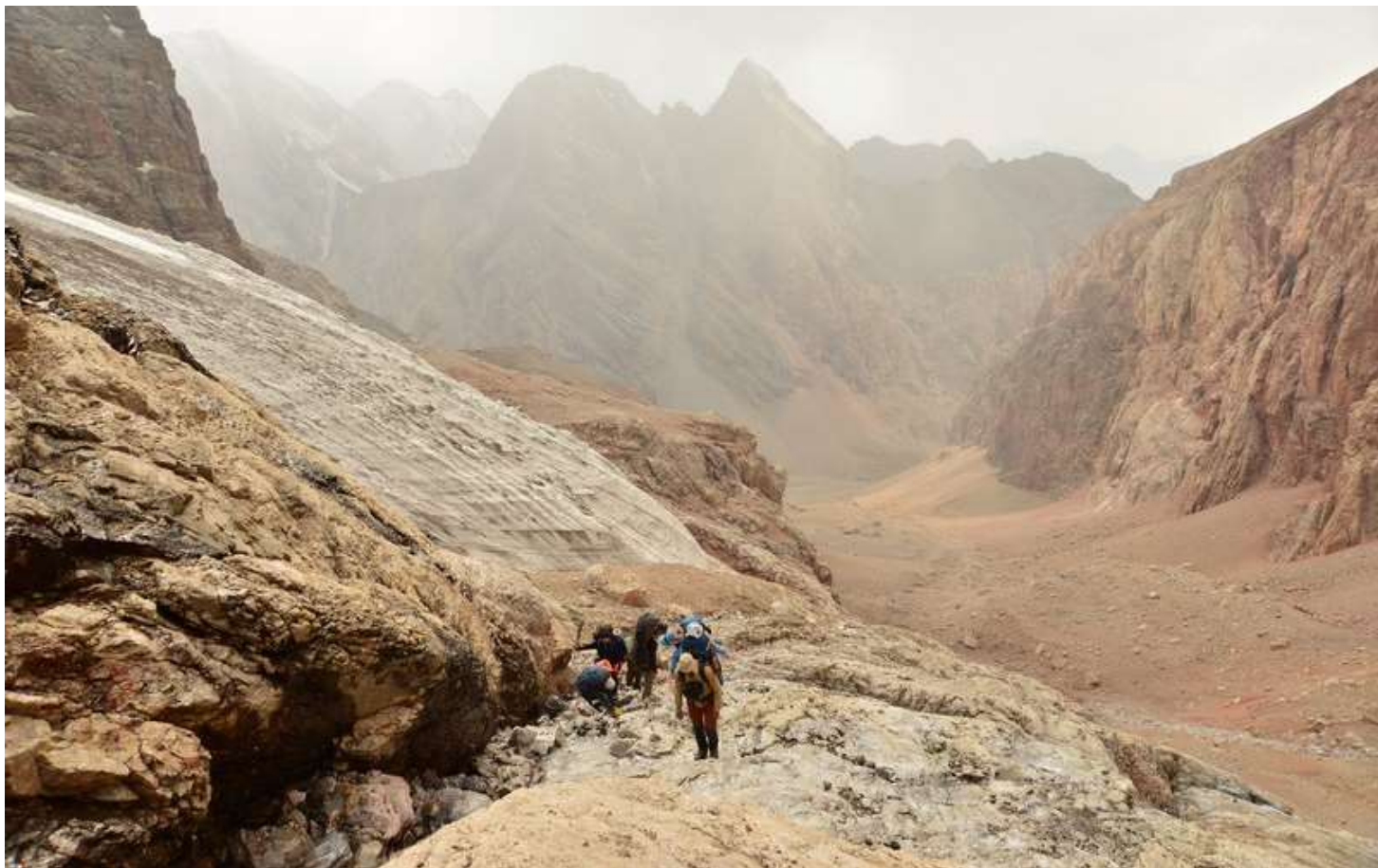
Рисунок 53 - Передвижение по бараньим лбам