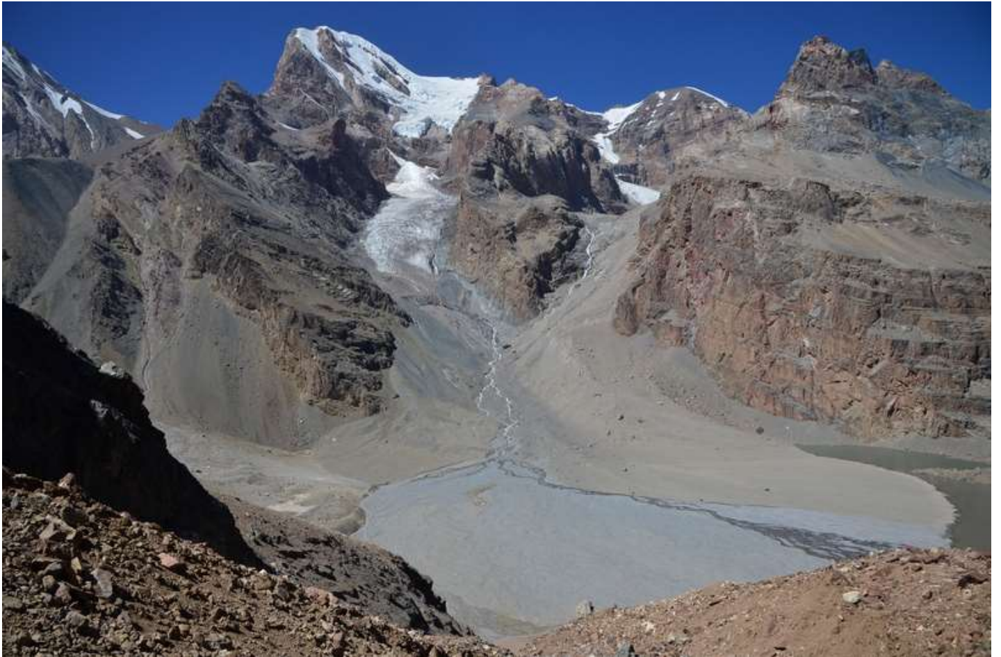
Рисунок 23 - Вид назад с первой ступени подъема