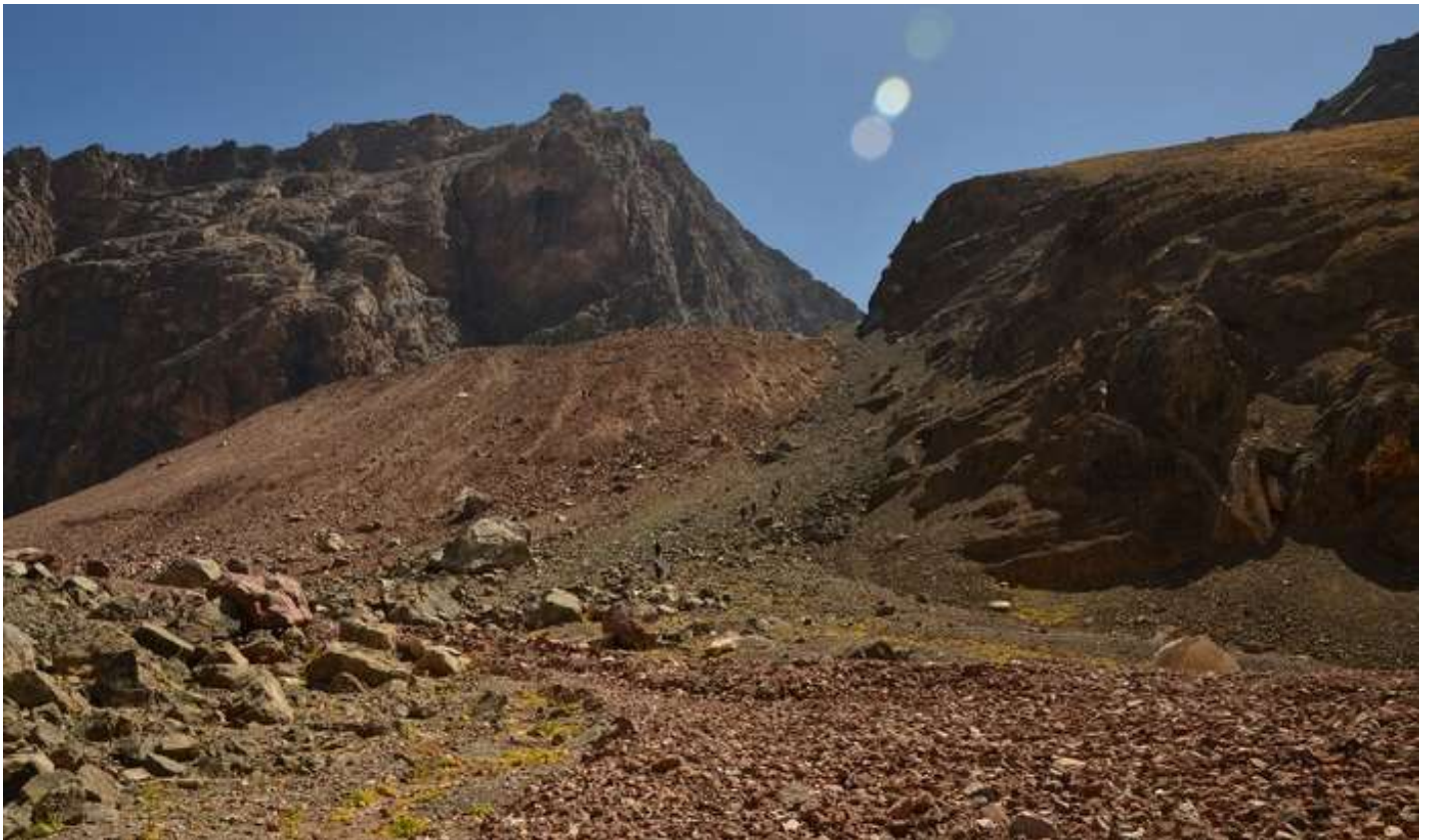
Рисунок 22 - Начало пути к пер.Казнок В от Мутных озер