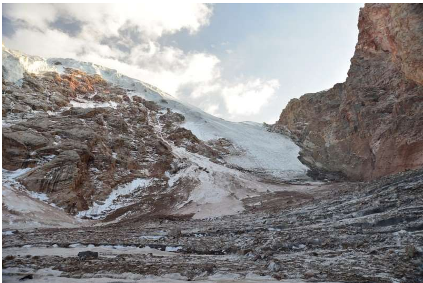
Рисунок 108 - Общий вид на северный склон пер.Седло Ганзы