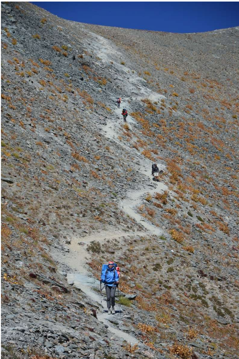
Рисунок 14 - Перевальный взлет Алаудинского на спуске