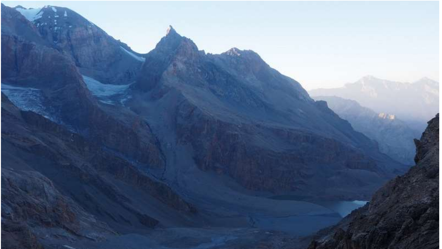
Рисунок 31 - Вид на первую ступень пер. Дон с седловины пер. Казнок 3