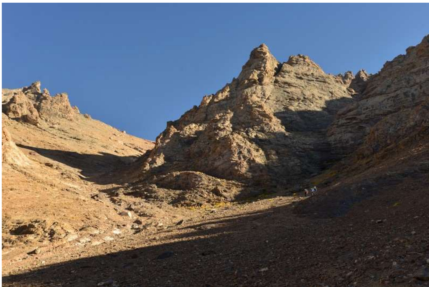
Рисунок 34 - В центральной части "каньона" ведущего к пер.Казнок 3