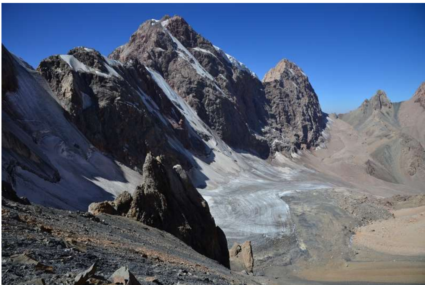
Рисунок 42 - Вид на запад с перевала