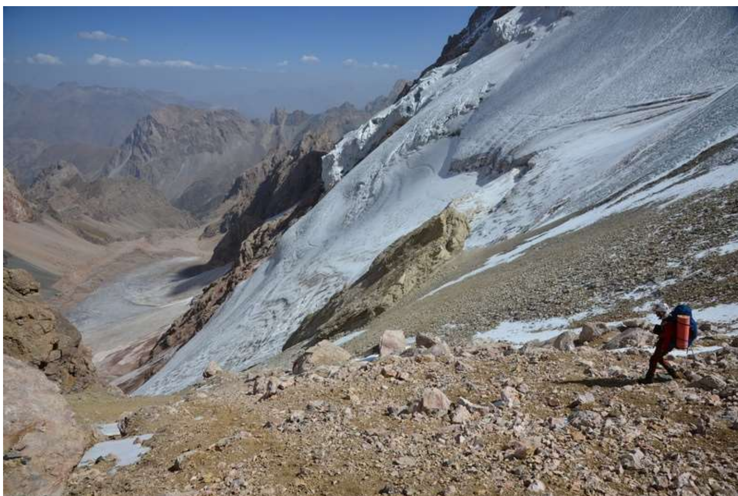
Рисунок 104 - Выход с пер.Седло Ганзы на северный склон перевала