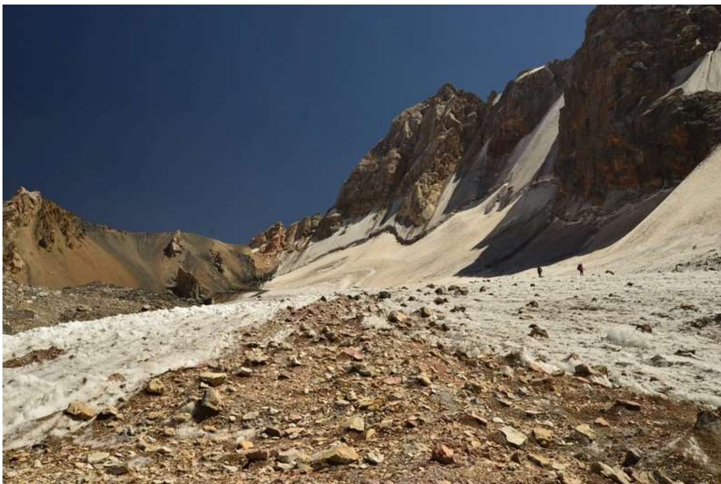
Рисунок 44 - Перевалы Блок. с ледника Л.Зиндон