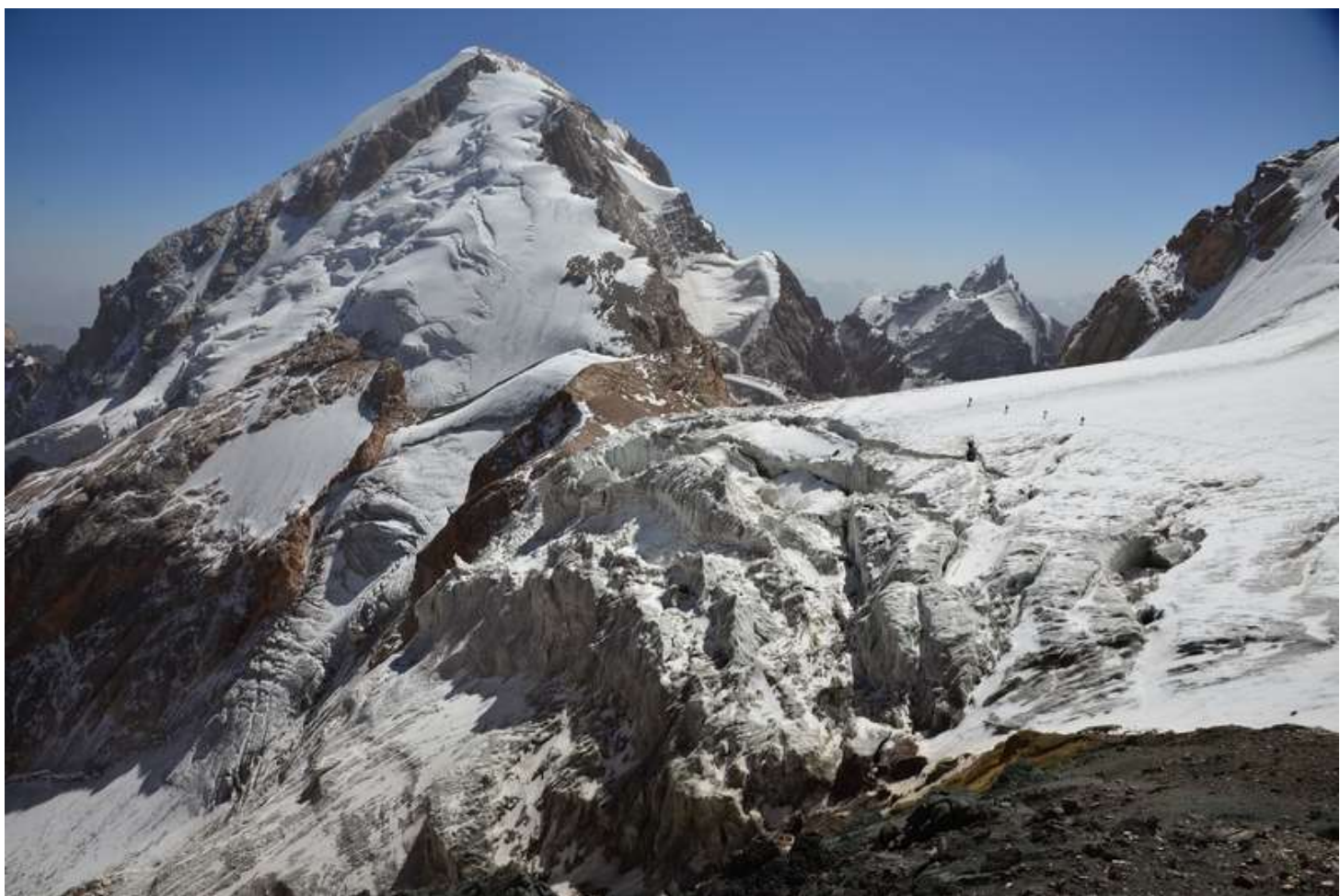
Рисунок 90 - Вид на траверс с пер.Гусева-Мухина Зап до пер.Седло Ганза