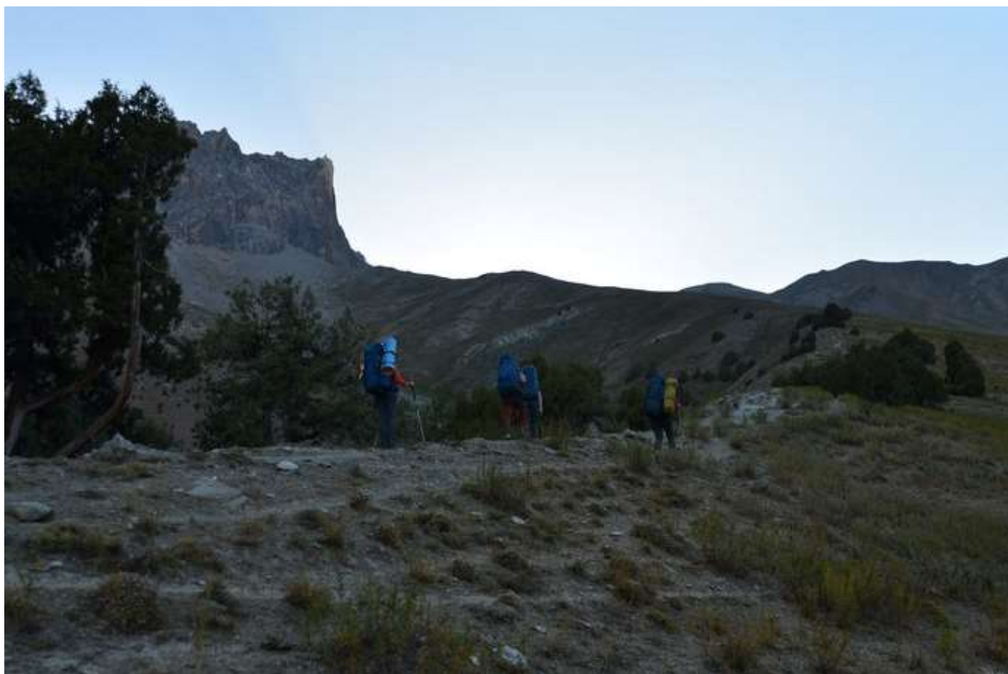
Рисунок 2 - по пыльным тропинкам набираем первую 100 м