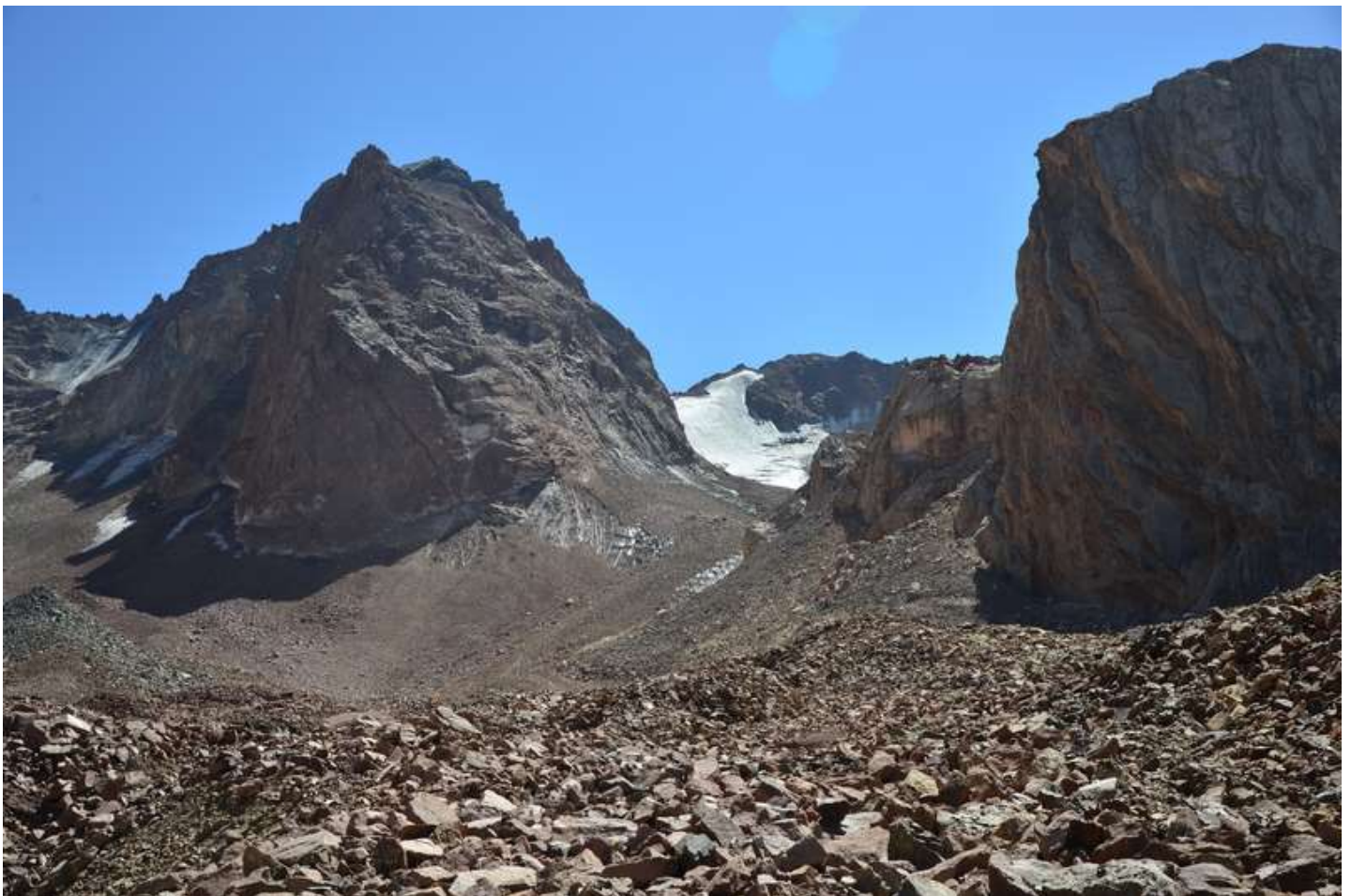
Рисунок 24 - перевальная бреш в отроге по пути к пер. Казнок В. На заднем плане перевальный взлет Мазалата