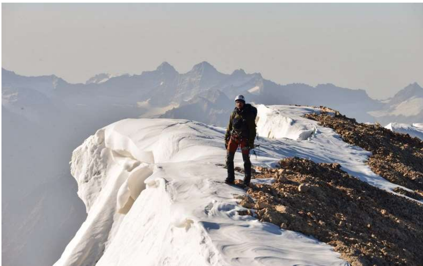
Рисунок 102 - На гребне Б.Ганзы