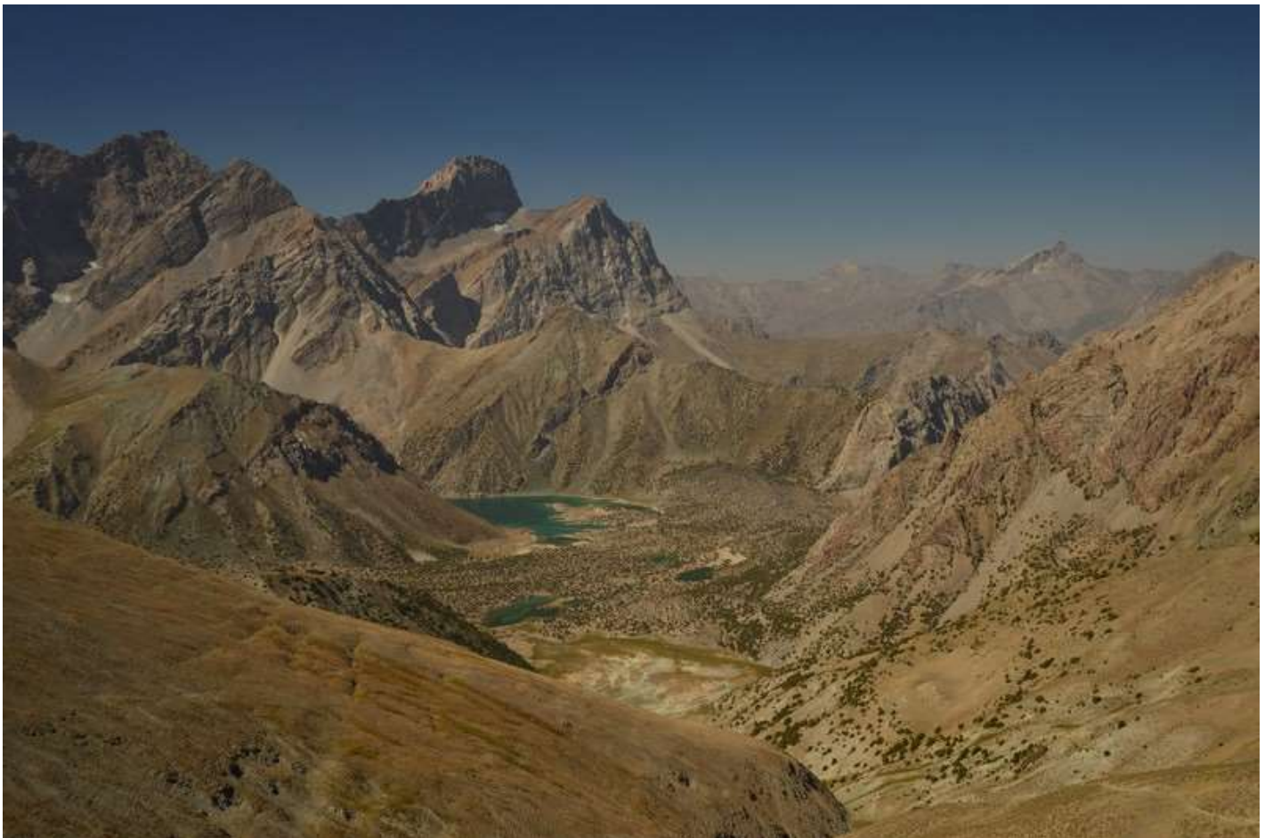
Рисунок 6 - Вид в сторону Куликалонских озер, пер. Флюорит, пер. Зиерат