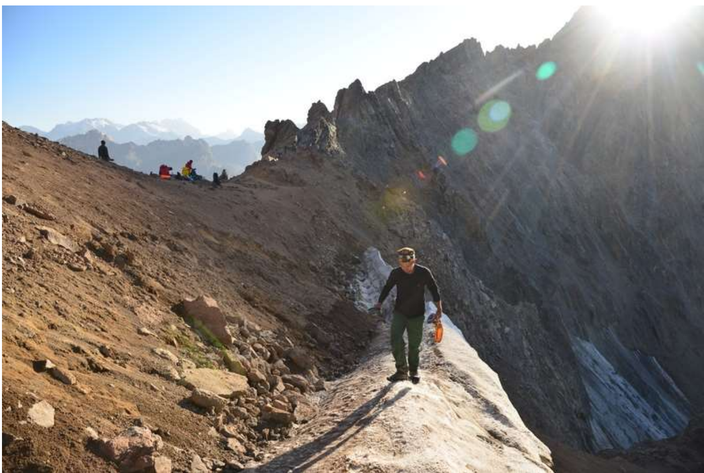
Рисунок 30 - Снежник на северном склоне пер.Казнок 3