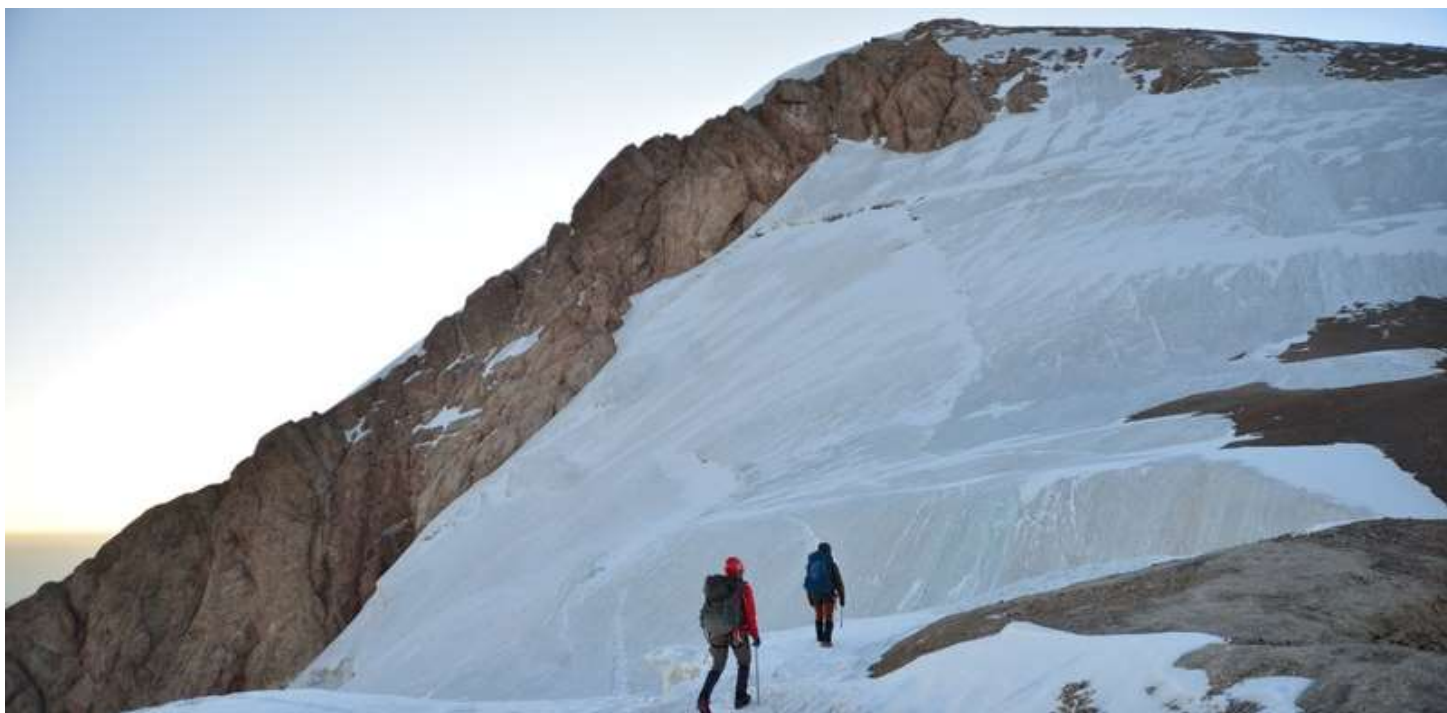
Рисунок 99 - Предвершинная ступень Б.Ганзы

Т.к. мы отставали по графику на один день, но части группы очень хотелось попасть на Большую Ганзу, то было принято решения делать восхождение рано утром. Вышли в 3:40 и на личной техники сделали восхождение, на вершине провели час. К 11:10 спустились на Седло Ганзы. Ходили мобильной группой из трех человек. Перекусили и продолжили спуск с перевала по леднику Желтый. На спуск провесили 10 веревок. Перевальный взлет подрезан довольно широким бергом, который обходиться слева по ходу движения в забитой продуктами жизнедеятельности ледника продуктами. За этот день дошли до Райских стоянок.