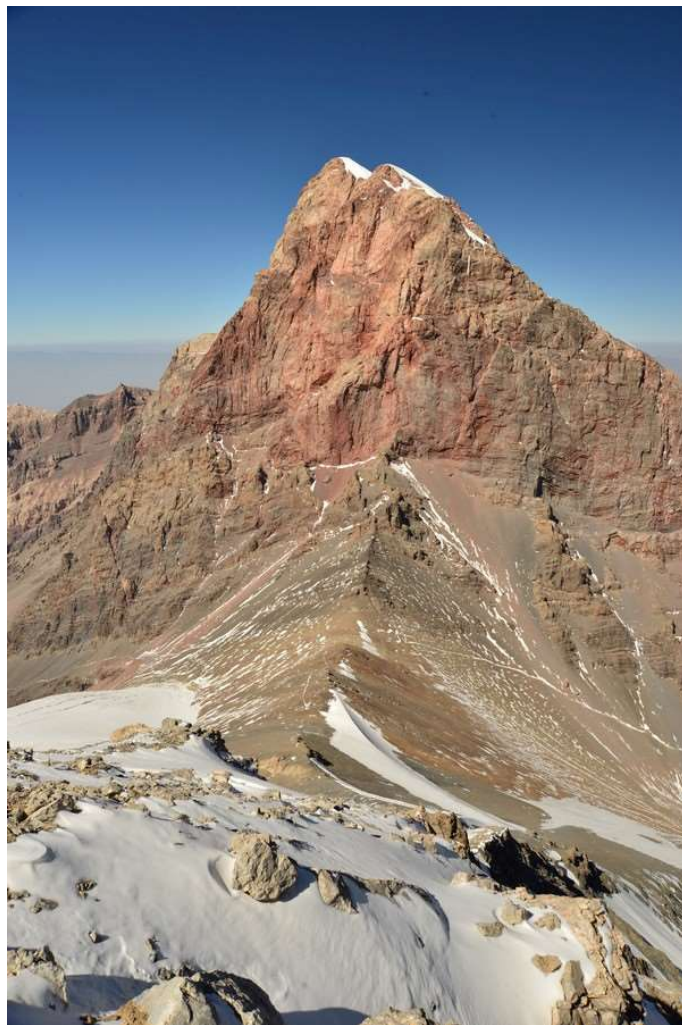
Рисунок 65 - Перевал и вершина Чимтарга с подъёма на Энергию