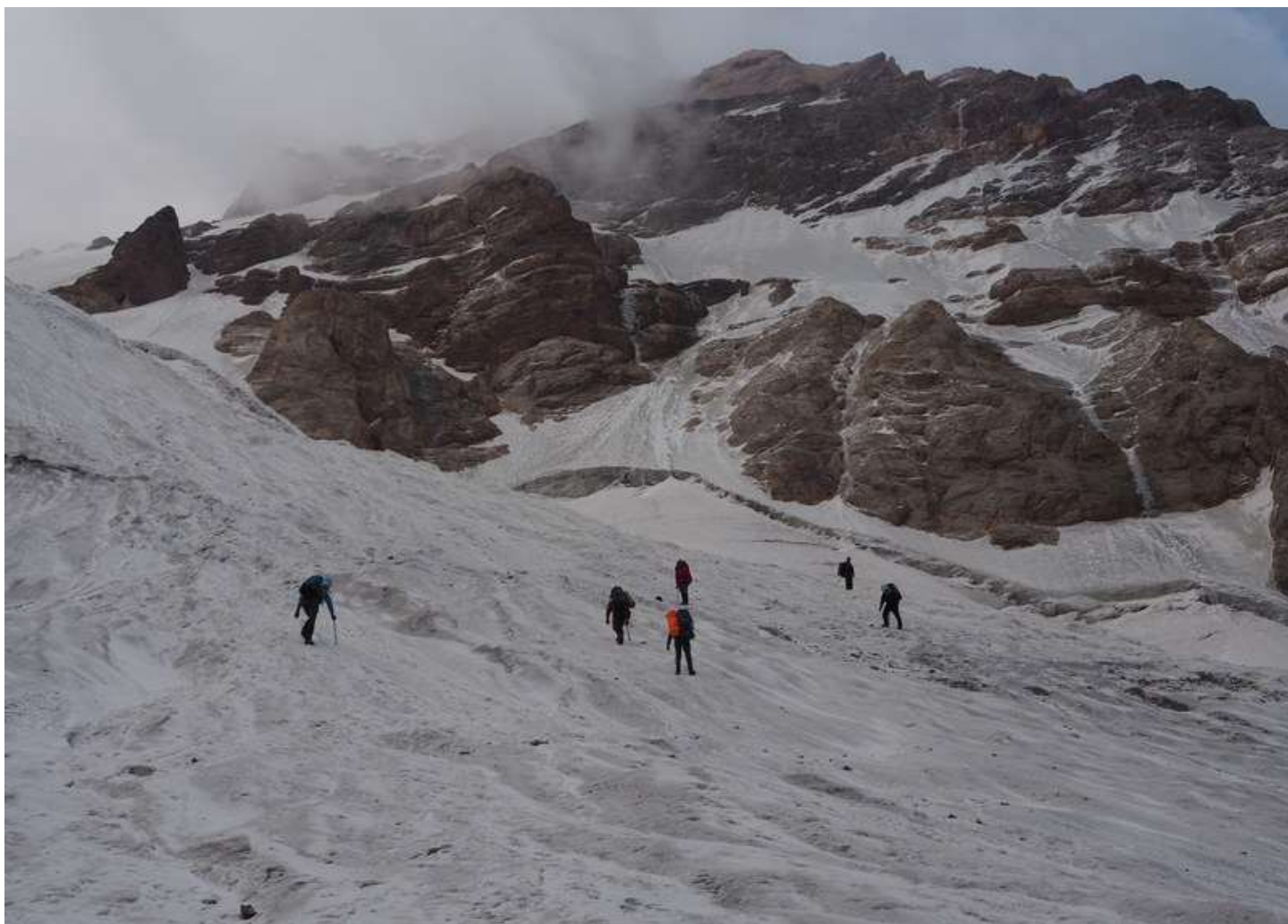
Рисунок 58 - Под склонами Чимтарги на леднике Курумоч

За пару переходов поднялись на перевал Мирали и погрузились в ожидание погоды.