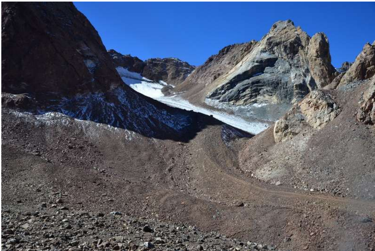
Рисунок 77 - Вид в "провал" в отроге в направлении пер. Казнок В