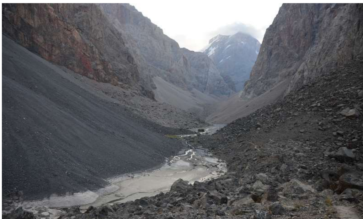
Рисунок 48 -Первые шаги по долине Правй Зиндон после преодоления вала на Б.Алло

Денек выдался интересный – максимальный к этому моменту набор высоты, да и погодка впервые начала хандрить – всякий там снежок, ветерок, тучки. Из интересных моментов, после своротки у большого камня воду мы встретили в достаточном количестве только на бараньих лбах, до этого мы могли ее слышать где-то в глубине камней. Воду на обед собирали с скал, думаю все-таки надо было перетерпеть пол переходика. В некоторых отчетах можно встретить «вариант обхода бараньих лбов по языку ледника», да, такой вариант не исключен, но надо иметь ввиду, что подход к языку не самый приятный, да и забраться на него слету не получится, он обрывается достаточно крутой стеной, практически вертикальной, с перепадом высоты метров 10. Ну и под конец площадки под палатки, в районе второй ступени ледника, ковыряли впервые самостоятельно