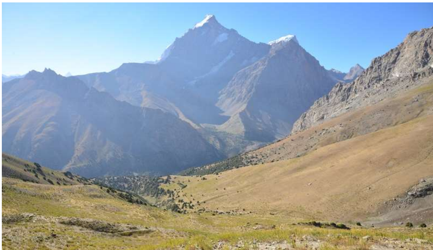
Рисунок 4 - Вид назад с пер. Лаудан Ложный

Ничего примечательного в этот день не случилось: жара, адаптация к всепоглощающей пыли и высоте, ну и конечно восторг от озер, арчи и скальных бастионов.