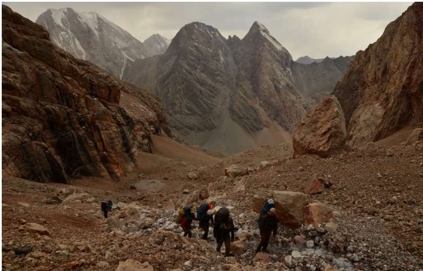
Рисунок 51 - Перед выходом на бараньи лбы