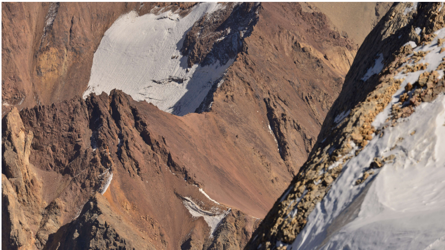
Рисунок 69 - Перевалы Казнок Восточный и Западный с Энергии