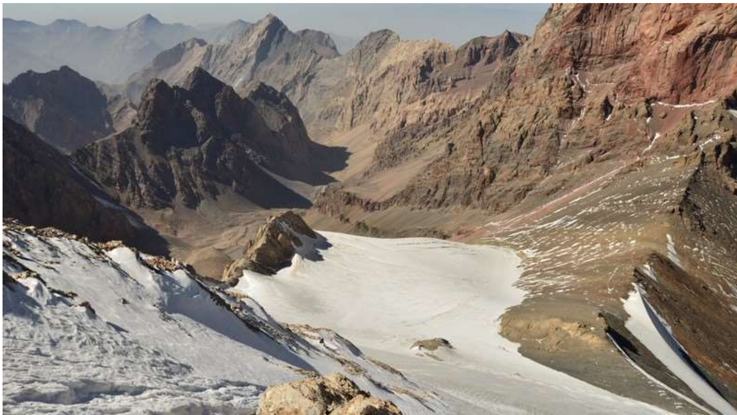
Рисунок 71 - Ледник Зиндон