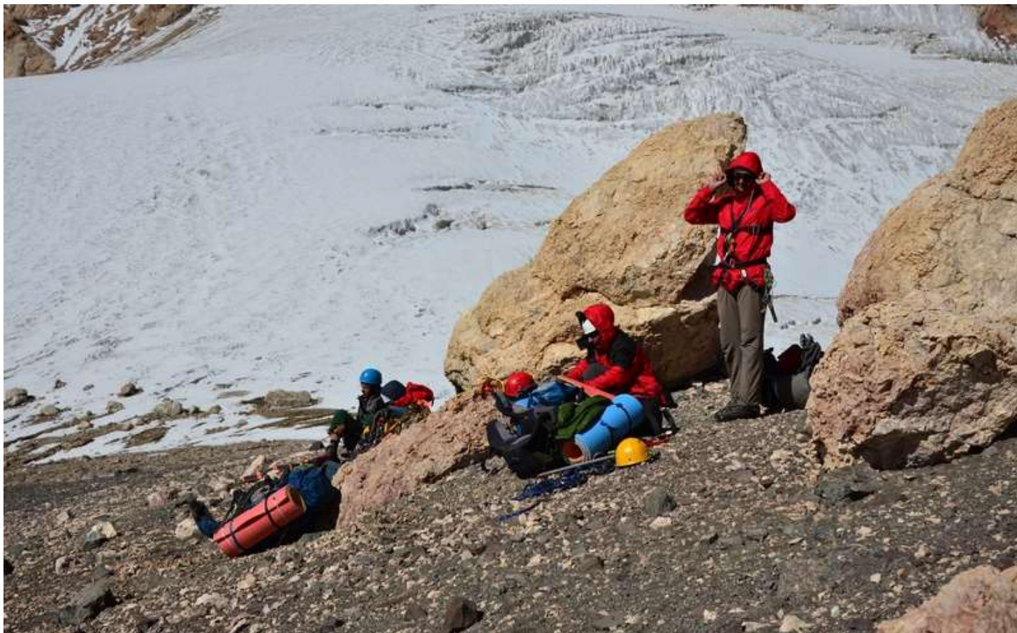
Рисунок 89 - Группа на пер. Гусева-Мухина Зап