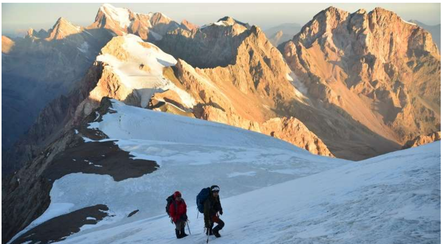
Рисунок 100 - На предвершинной ступене