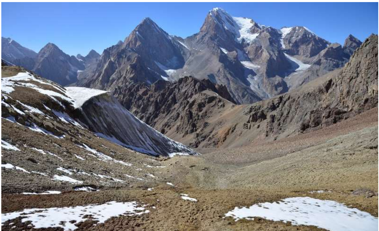
Рисунок 80 - Пер.ВАА с пер.6868