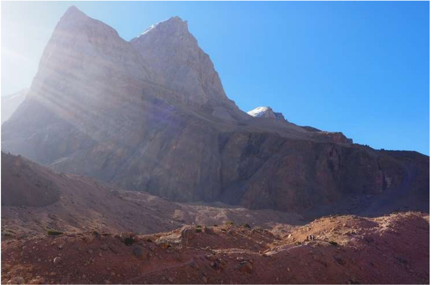
Рисунок 19 - Тропа к Мутным озерам