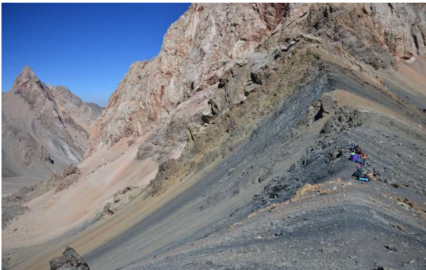
Рисунок 40 - Перевальная седловина Двойного Северного