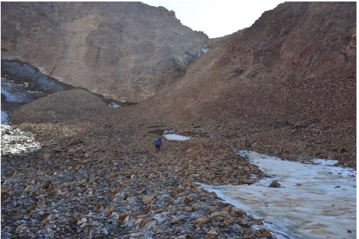
Рисунок 26 - Перевальный взлет Казнок В