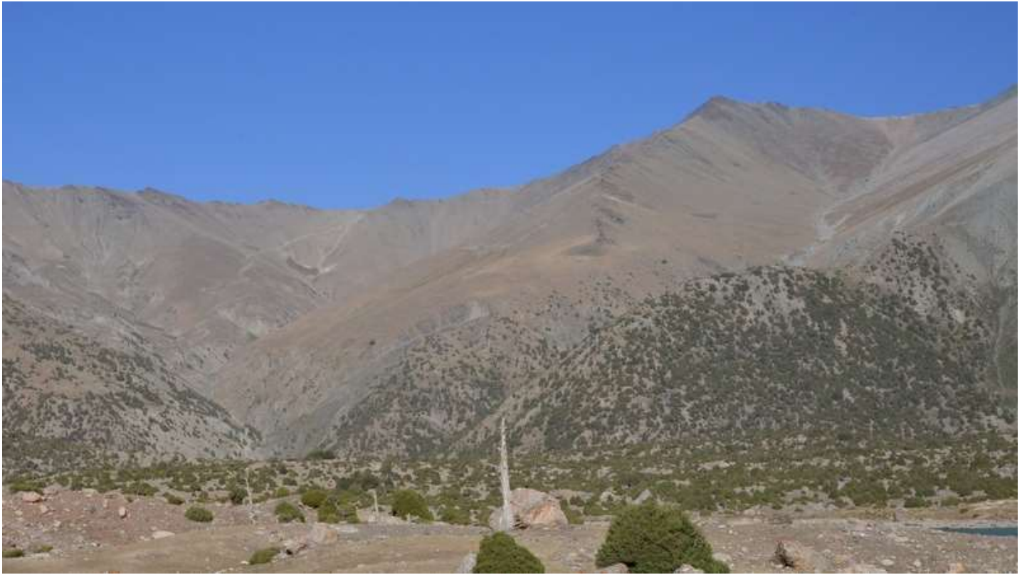
Рисунок 7 - Вид с Куликалонских озер на путь спуска с пер. Лаудан