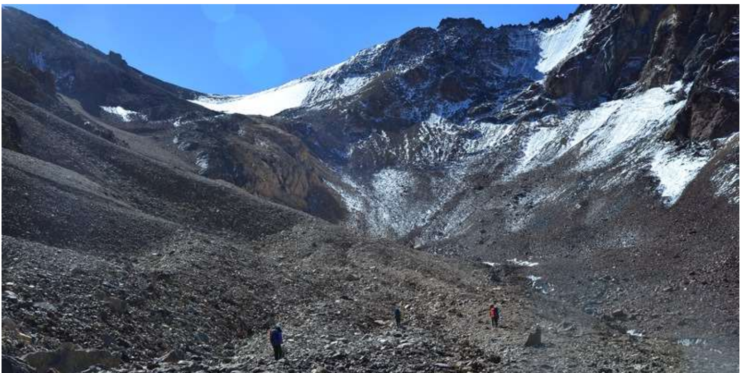
Рисунок 76 - Подход под пер. ВАА

В этот день мы обнаружили новый нюанс перевала 6868, до этого я его ни в одном отчете не встречал. К указанному перевалу мы подобралась к обеду, т.е. на его склонах мы оказались, когда солнце светило уже высоко и очень интенсивно. Так вот, на стыке ледника и морены, образующей западный склон перевала, летело такое количество камней, что этого счастья бы хватило завалить не одну группу. Будьте бдительны и осторожны.