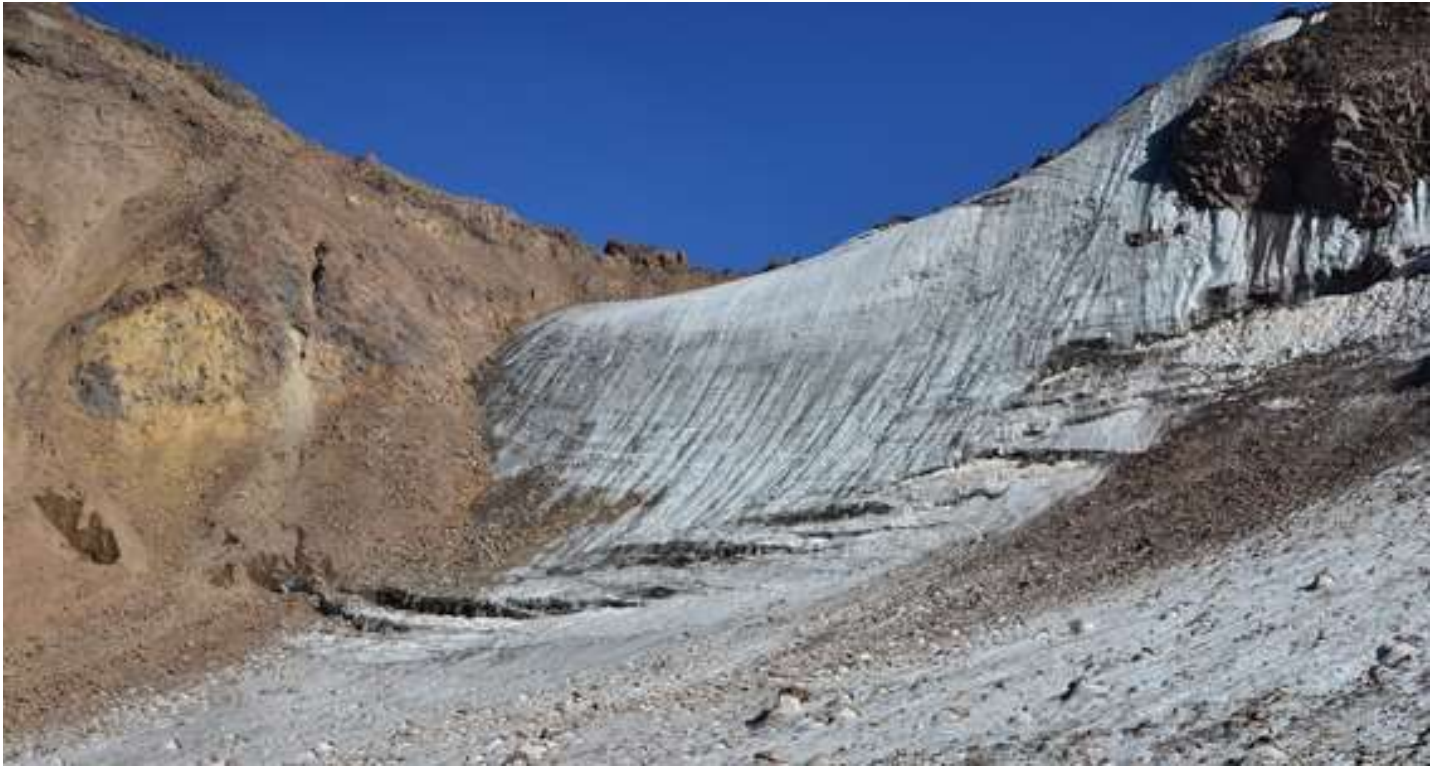
Рисунок 25 - Перевал Мазалат