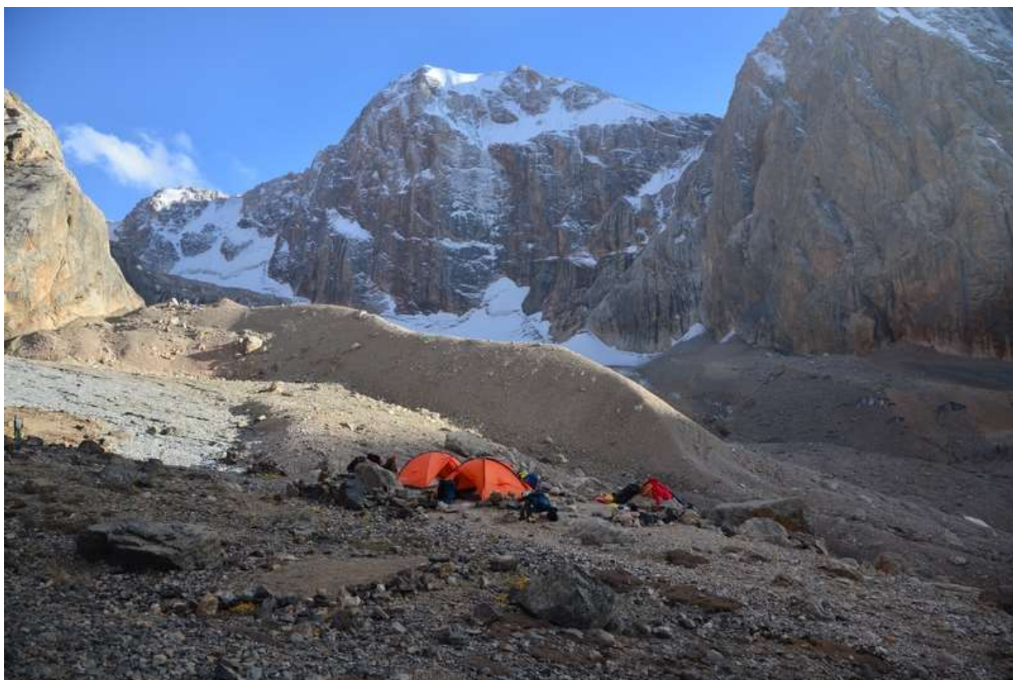
Рисунок 62 - Площадки перед резким набором тропы к перевалу Чимтарга