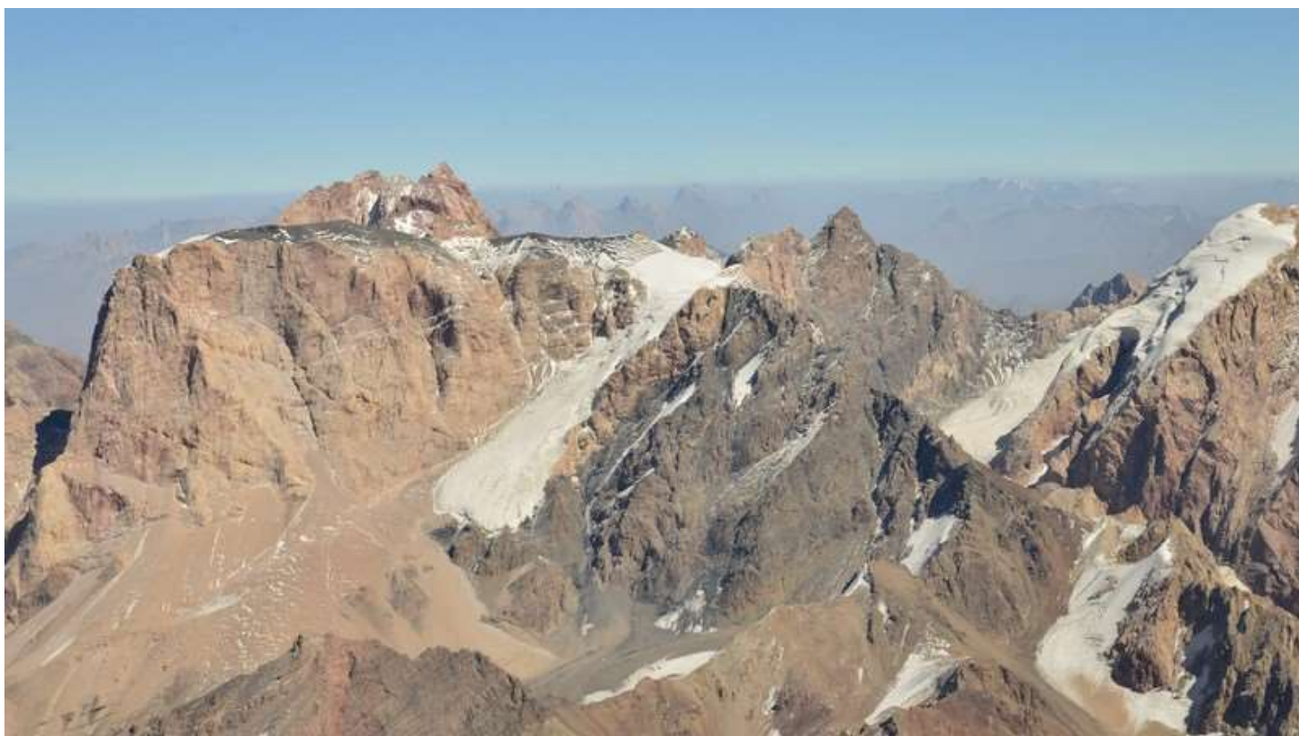
Рисунок 68 - Ледник Замок, перевалы ВАА и 6868