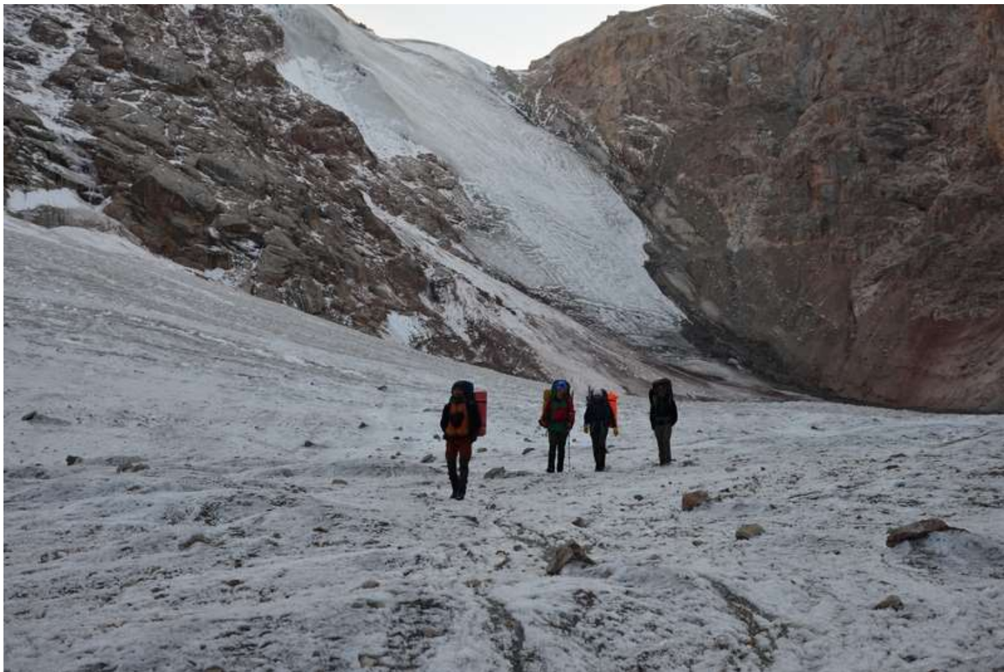
Рисунок 109 - Общий вид на северный склон пер.Седло Ганзы