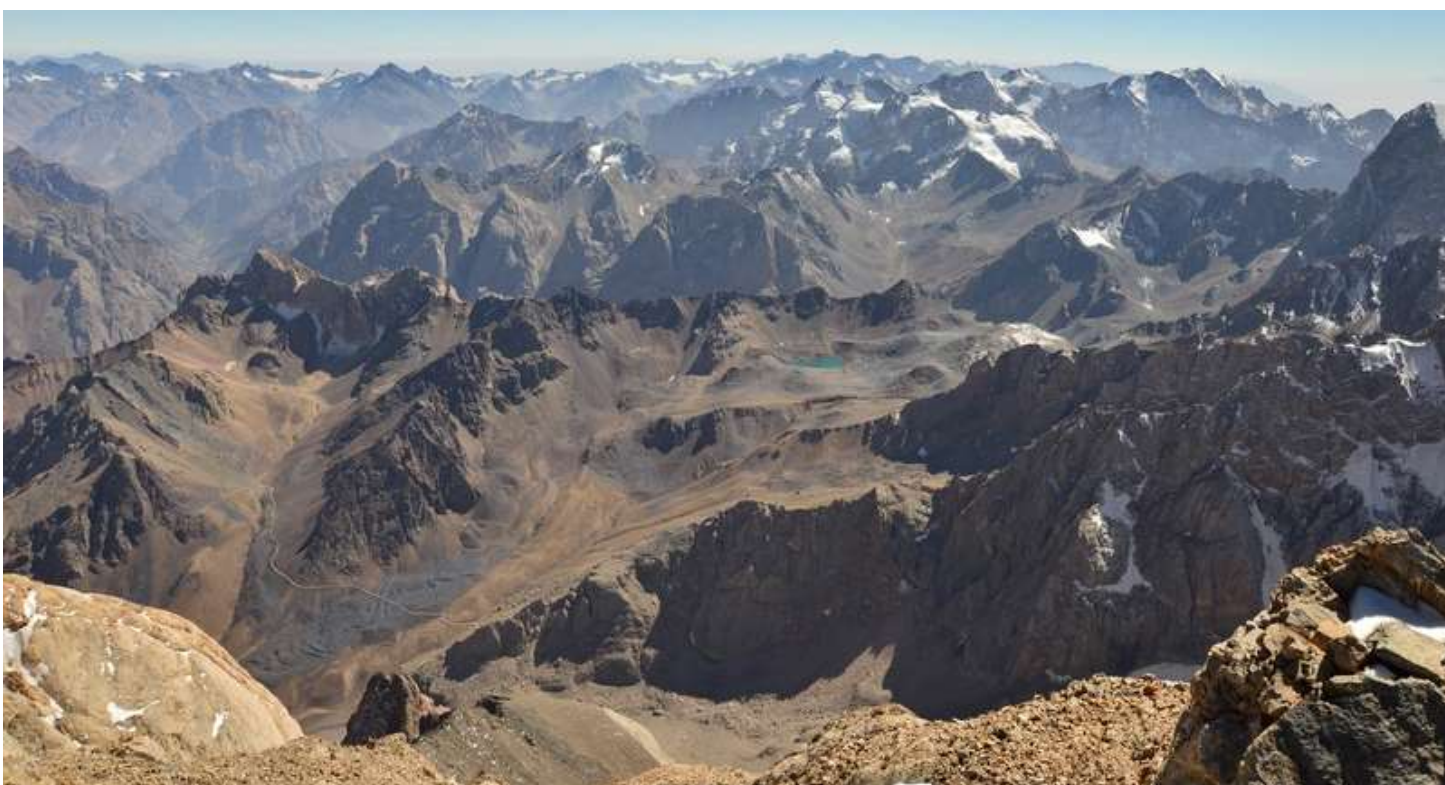
Рисунок 64 - Вид на оз.Бирюзовое с Энергии

До перевала поднимались двумя разными путями, часть группы шла по натоптанной тропе, получая «фанский кайф», а вторая, отказавшись от сего удовольствия пошла прыгать по камням, но счастье их было не продолжительным, т.к. пришлось преодолевать скальный пояс и все также выходить на тропу. В итоге передвижение по тропе оказалось более быстрым, но менее «интересным».