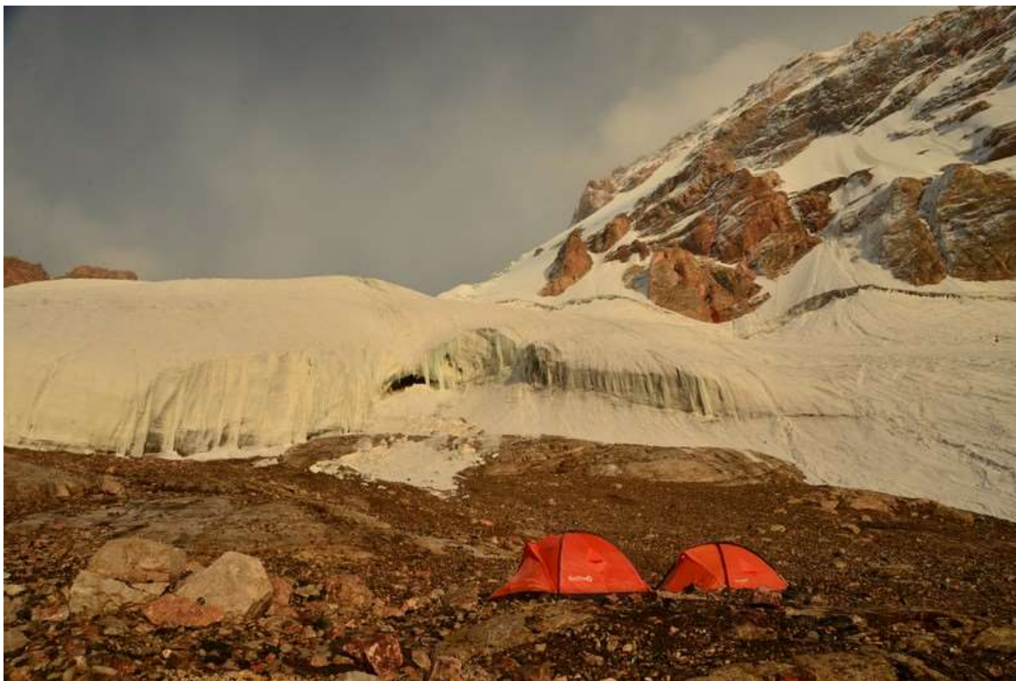
Рисунок 54 - Площадки над бараньими лбами, перед второй ступенью ледника