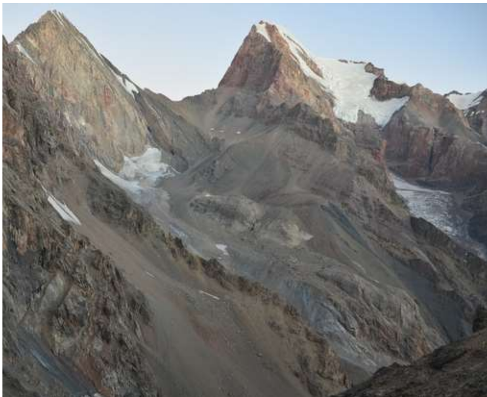
Рисунок 32 - Вид на спуск с пер.Чимтарга с пер.Казнок

Шлепаешь сначала по тропе, потом по дороге – впитываешь пыль ботинками и легкими – Фанский кайф. Но этот кайф мы испытывали не на всем пути - Аллилуйя, он закончился на своротке в правый приток реки Казнок, в верховьях которого мы ушли в пересохшее русло, где можно было насладиться теньком, попрыгать козами, и порой даже передвигаться на четырех конечностях.