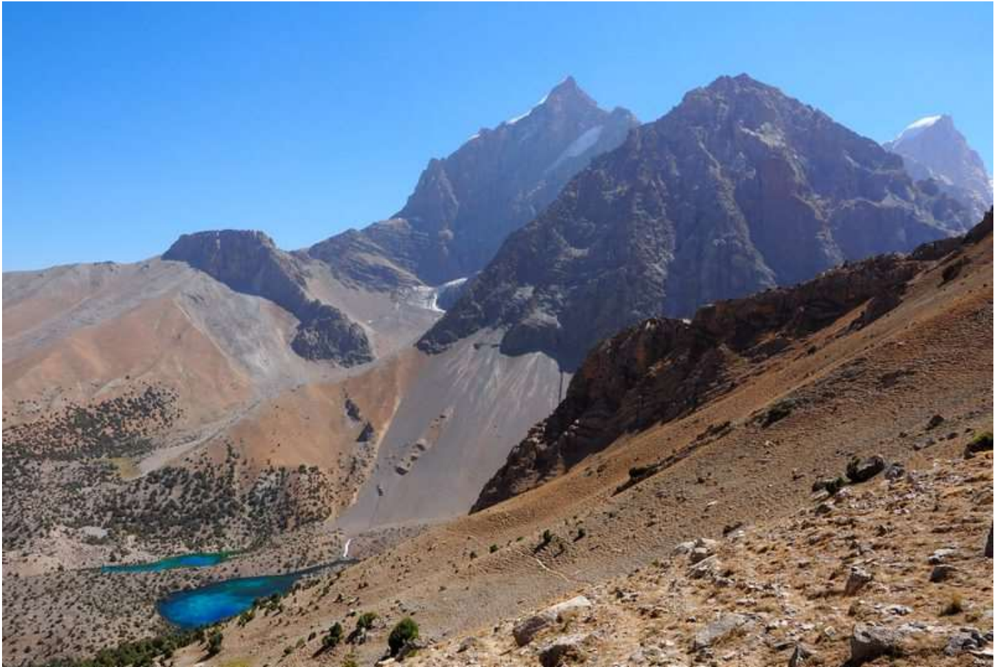
Рисунок 15 - Вид на оз.Алаудинское с спуска с одноименного перевала. Группа двигалась по правому борту долины. Основная тропа идет к чайхане по левому борту.