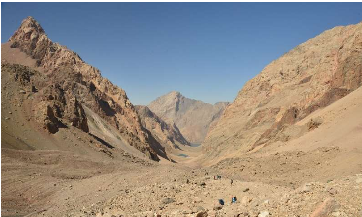
Рисунок 45 - Долина реки Левый Зиндон