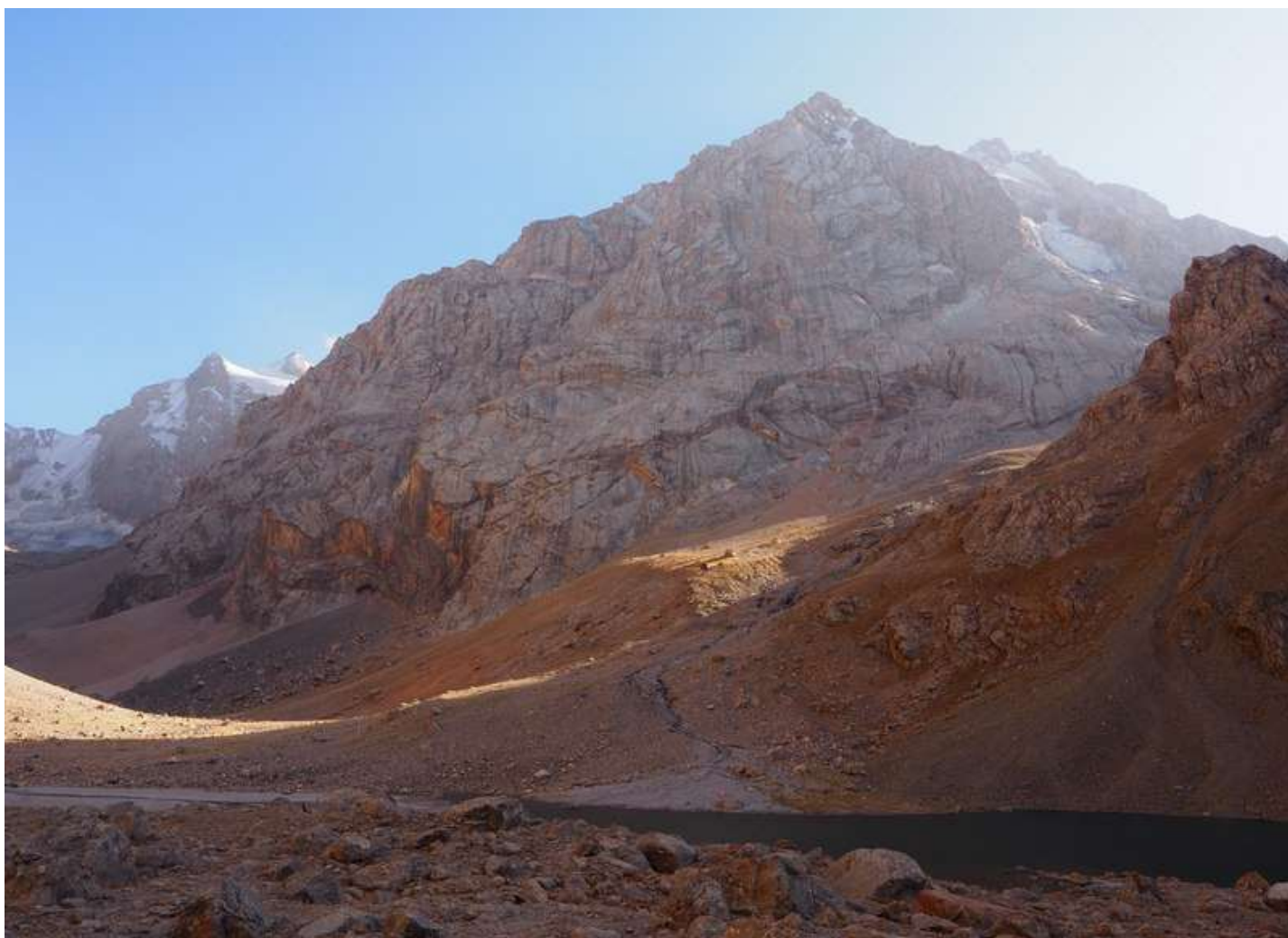
Рисунок 46 - Берега оз. Малого Алло и пик Демо