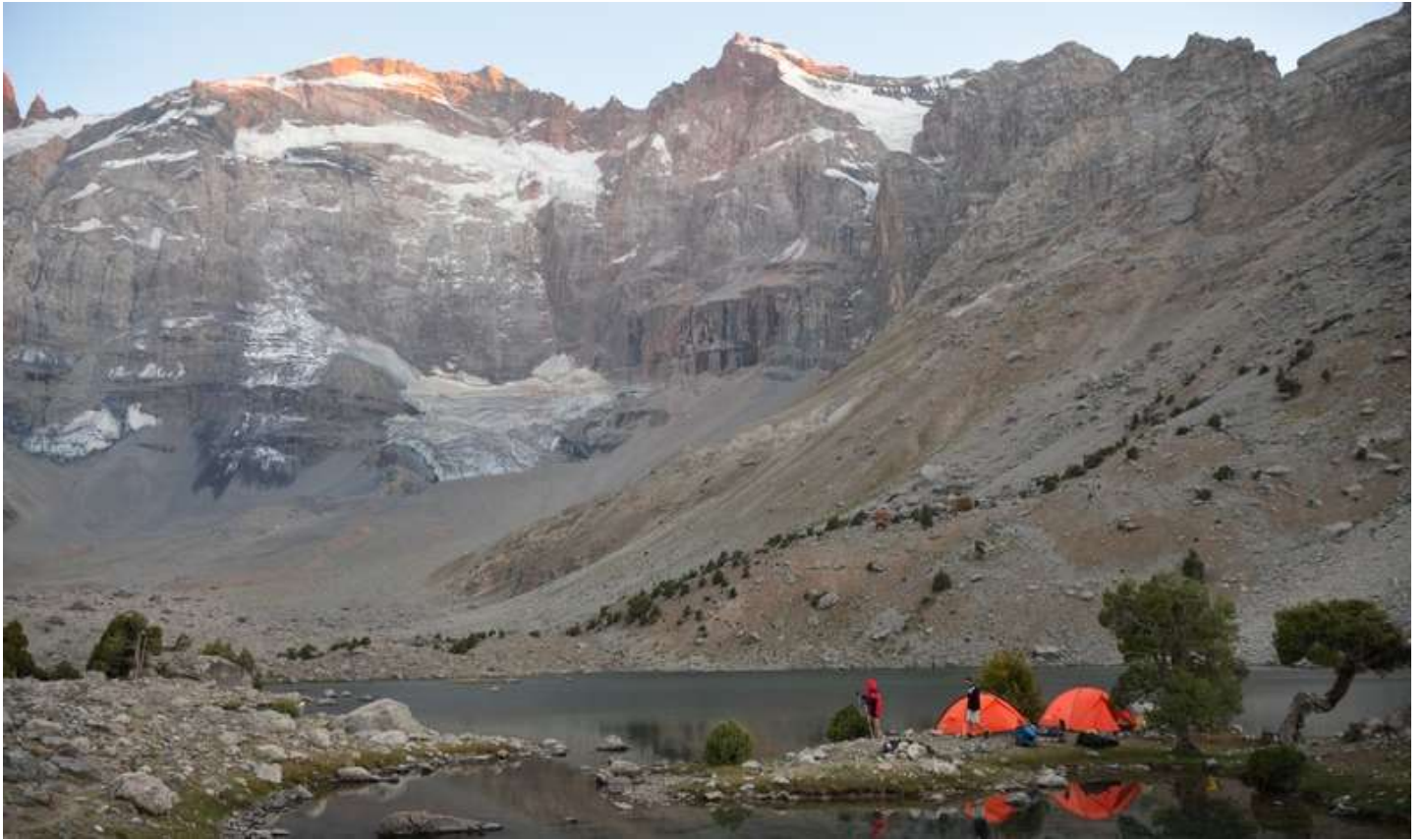
Рисунок 11 - Стоянки на северной оконечности оз. Душаха