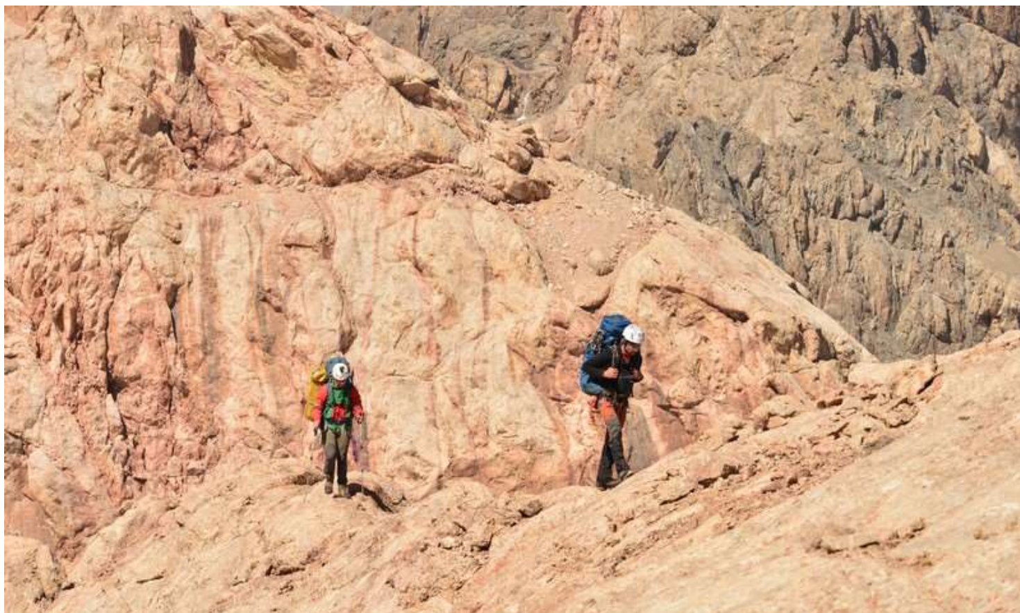
Рисунок 93 - Траверсный гребень. В этом месте был снят расшатавшийся крюк