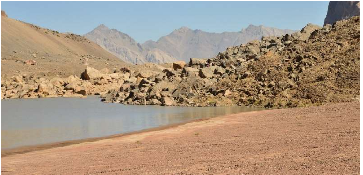
Рисунок 21 - Восточный берег Мутных