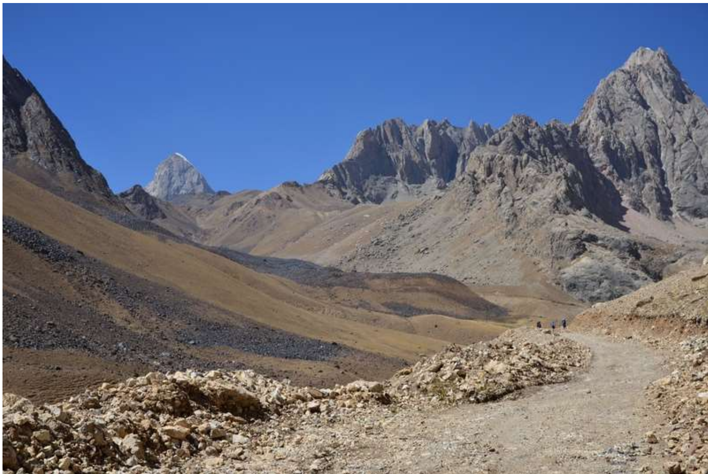
Рисунок 35 - Дорога вдоль р.Казнок. Можно рассматривать как вариант заброски на чем-то повышенной проходимости