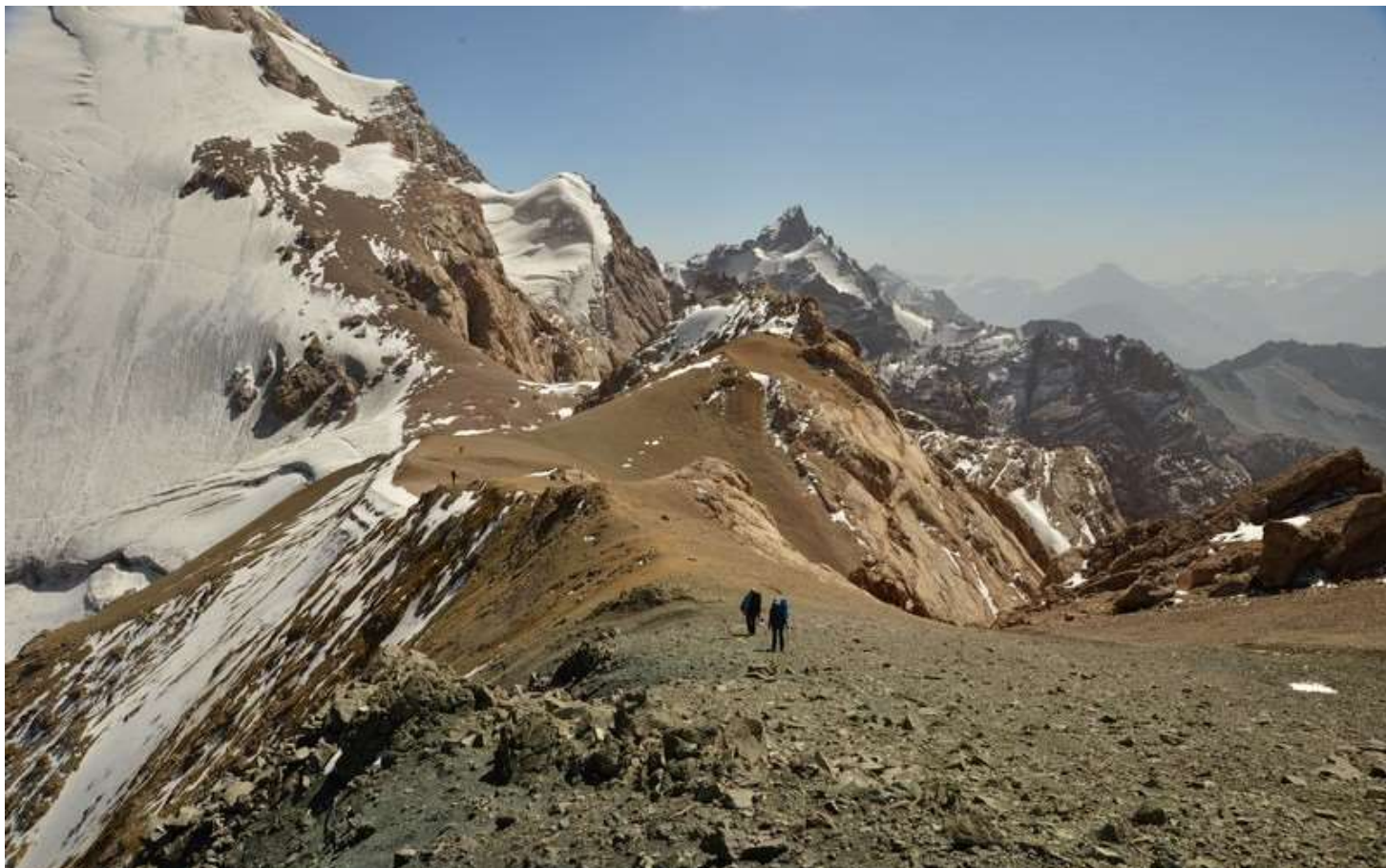
Рисунок 95 - на выходе к пер.Седло Гансы