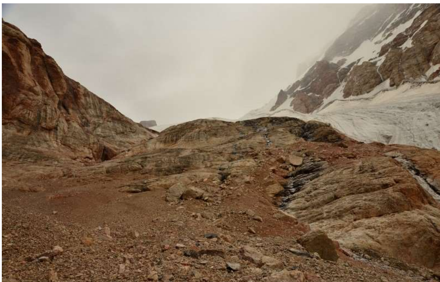
Рисунок 52 - Бараньи лбы