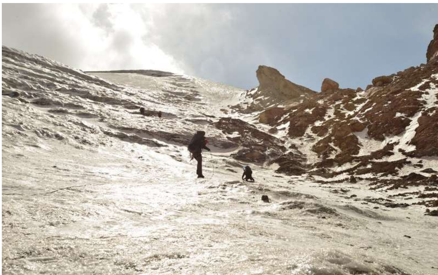
Рисунок 106 - Прохождение северного перевального взлета пер.Седло Ганзы