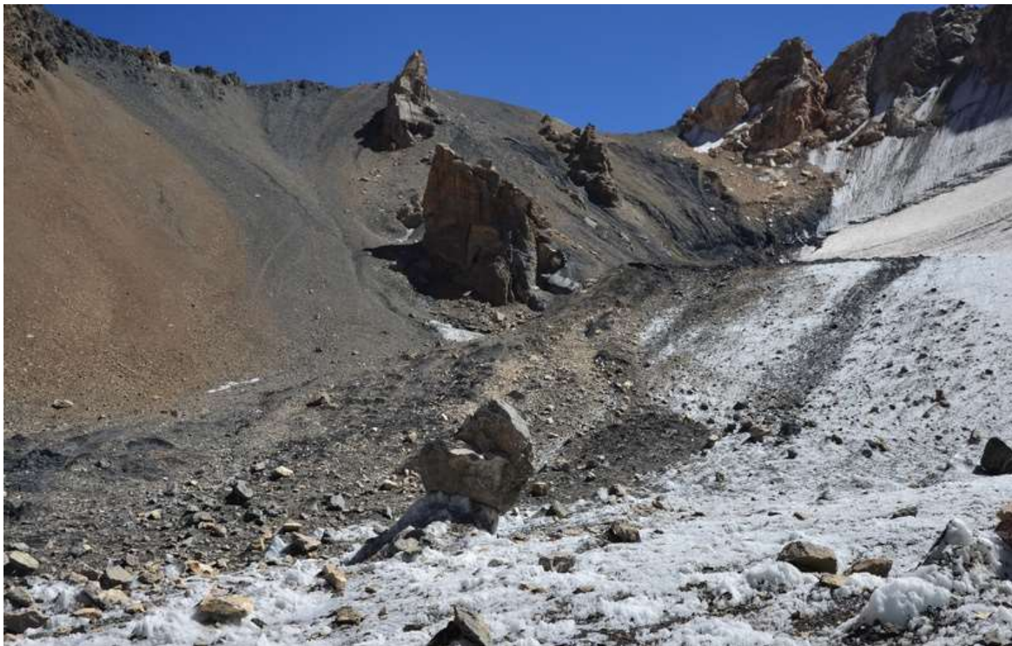
Рисунок 43 - Западный перевальный взлет Двойного Северного