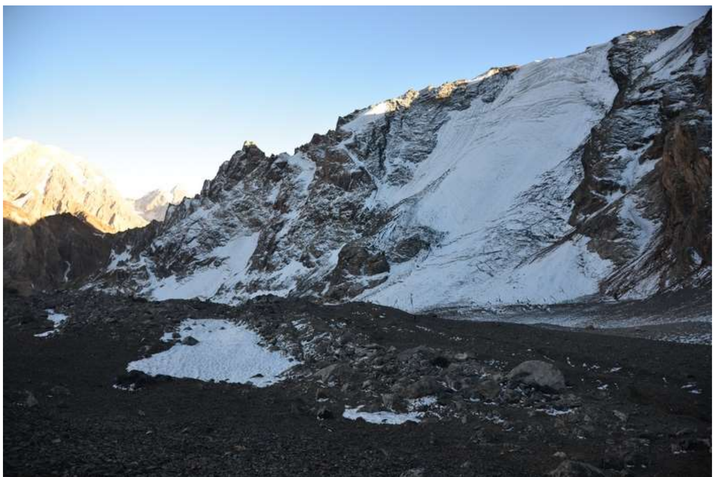
Рисунок 74 - Перевал Энергия