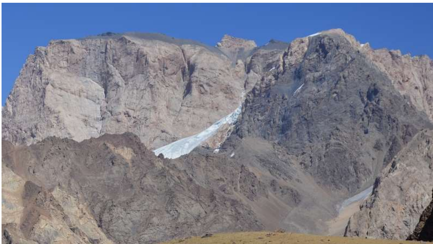
Рисунок 36 - Вид на в.Замок, пер.ВАА