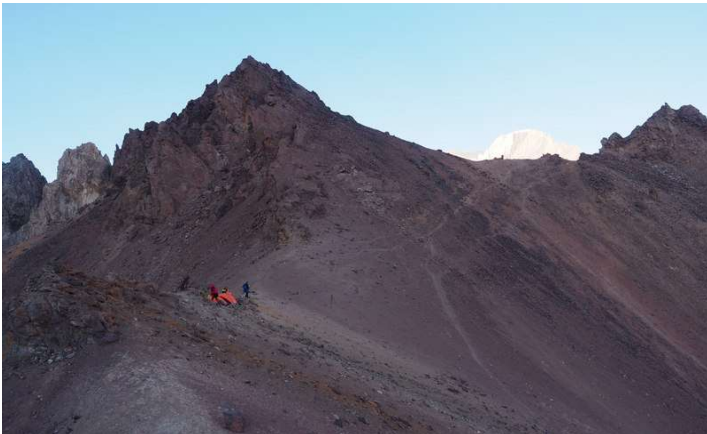
Рисунок 29 - Вид на седловину и траверс между пер.Казнок + тропа на спуск