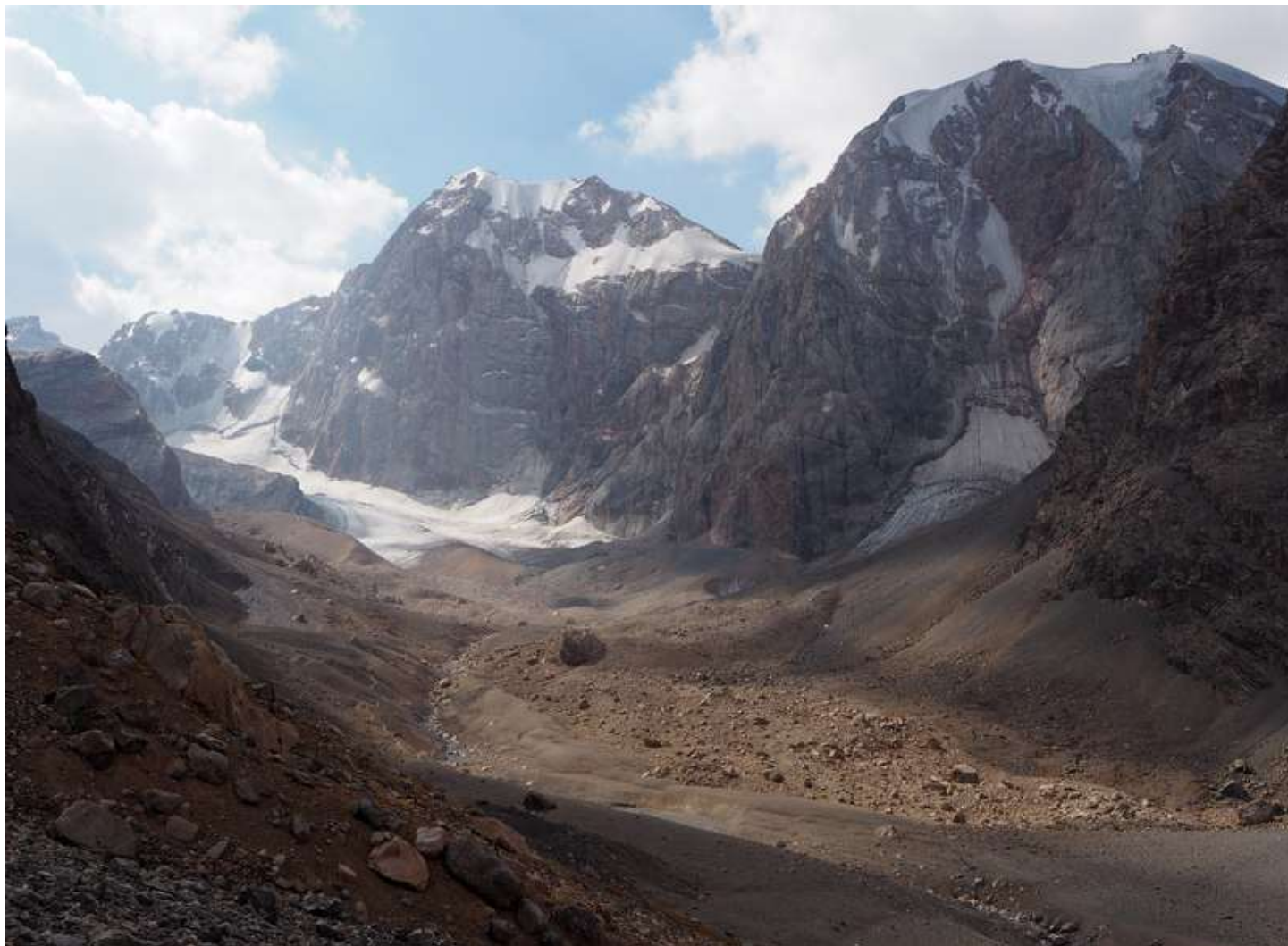
Рисунок 49 - Тропа в направлении пер.Чимтарга