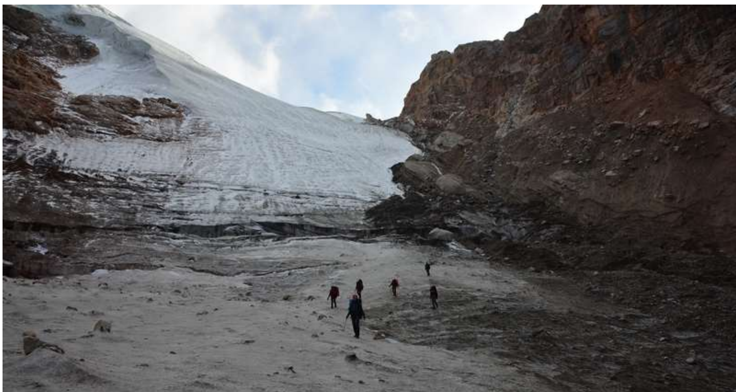
Рисунок 110 - Берг и вид на путь обхода