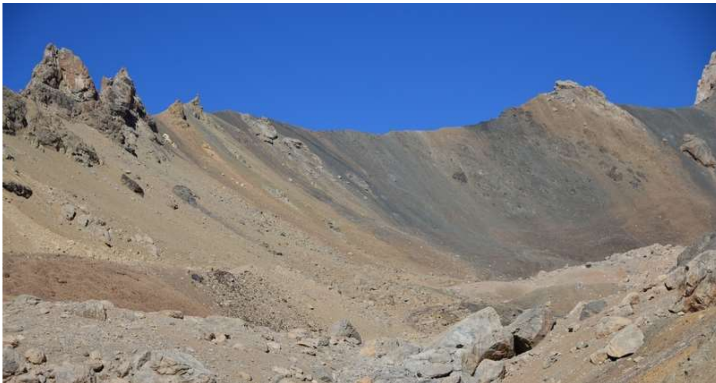
Рисунок 39 - Перевальный взлет Двойного Северного

Особых технических моментов по этому дню не было, все тот же Фанский кайф. Единственное, что стоит отметить, так это то, что нам удалось пройти по нижним скальным плитам, составляющим восточный берег, оз. Б. Алло.