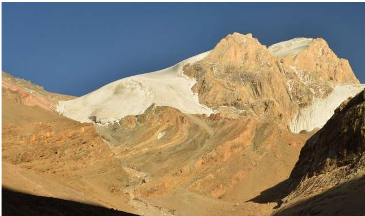
Рисунок 63 - Обнаженная Энергия