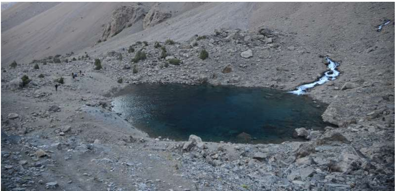
Рисунок 18 - Берега оз.Пиала

В первой половине дня мы прикинулись ишаками и тащили всю поклажу до мутных озер, не самое приятное занятие, и порой пресловутое «И-а» срывалось с губ. В городе были некоторые подозрения на трудность этого дня по поводу адаптации, но в рамках этого вопроса было все гуд. Теперь то, что не совсем предвиделось. Подъем на перевал Казнок В. – не самый приятный: вроде как веревки вешать рано, а на личной технике не всем приятно идти. Связано это с плотностью поверхности в последней трети перевального взлета, до этого момента площадка под ноги формируется очень даже хорошо. После того, как справились с упомянутыми невзгодами и поднялись на перевал, обнаружили, что вода в какой-либо форме отсутствует. Произведя визуальную рекогносцировку склонов, было установлено, что на пер. Казнок З остался снежник. Выбирать не приходится, по натопанной тропе дошли до упомянутого перевала и на нем разбили лагерь.