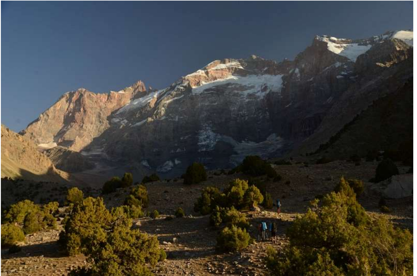
Рисунок 9 - Вид на стену Мирали