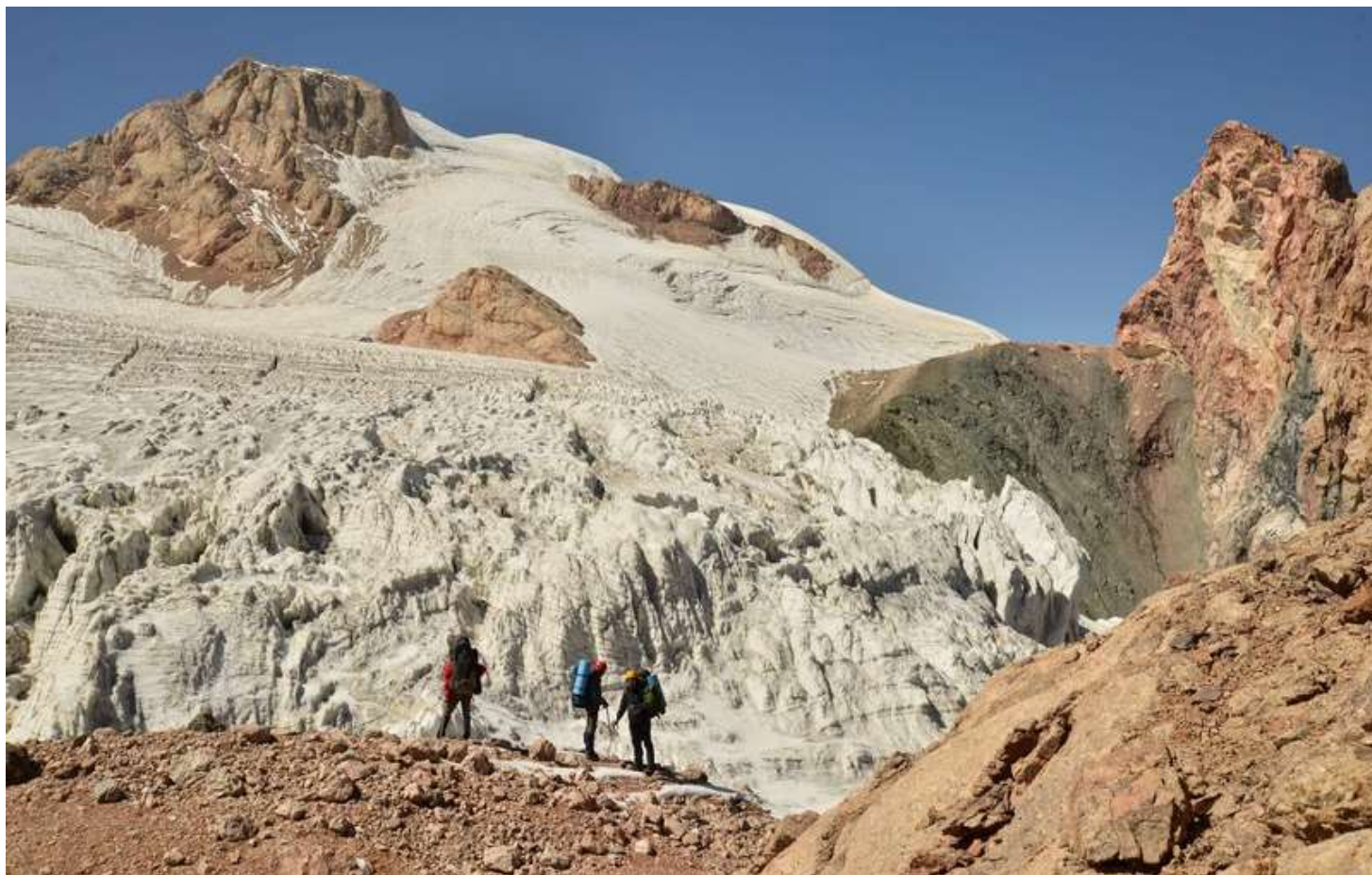
Рисунок 92- Вид на в.М.Ганза и пер. Гусева-Мухина Зап. с траверса