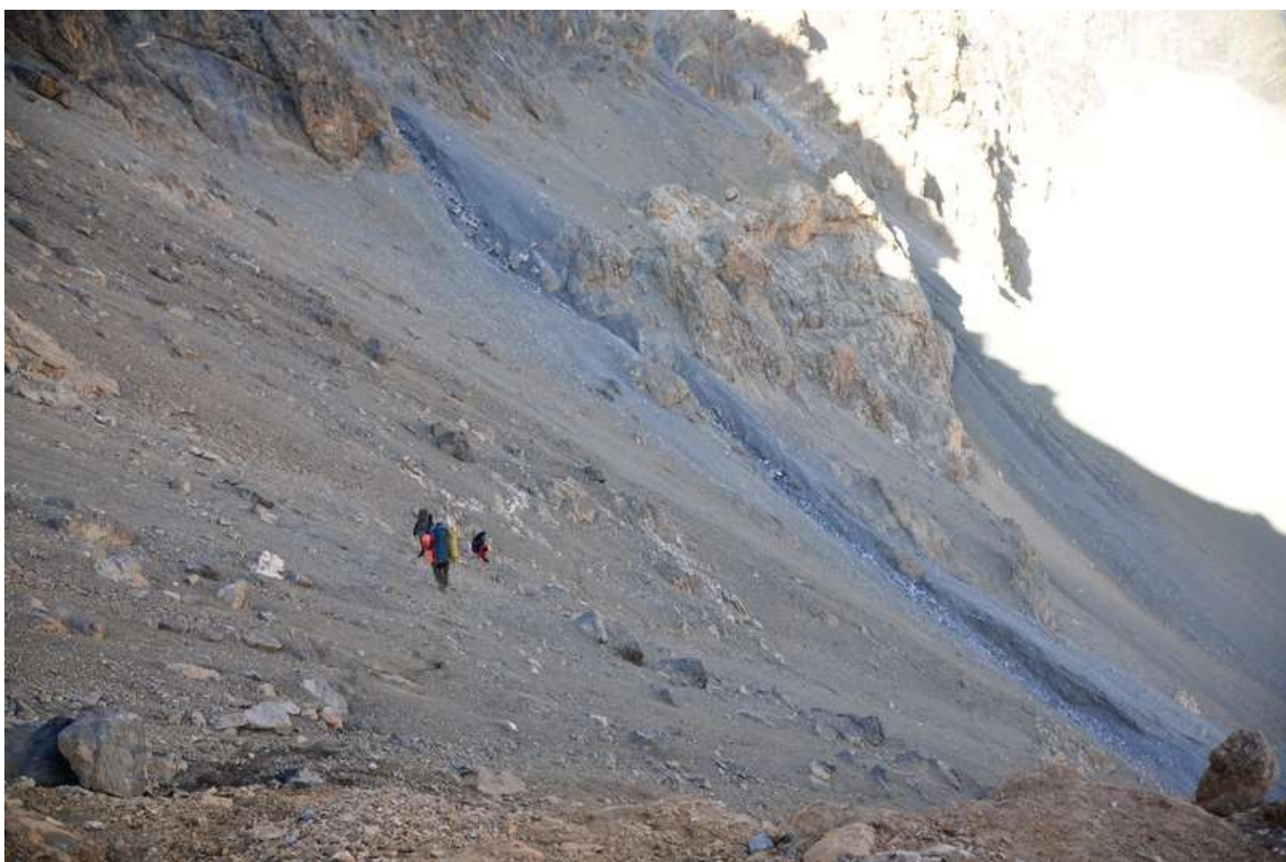
Рисунок 84 - Спуск на л.Малая ганза с пер.6866