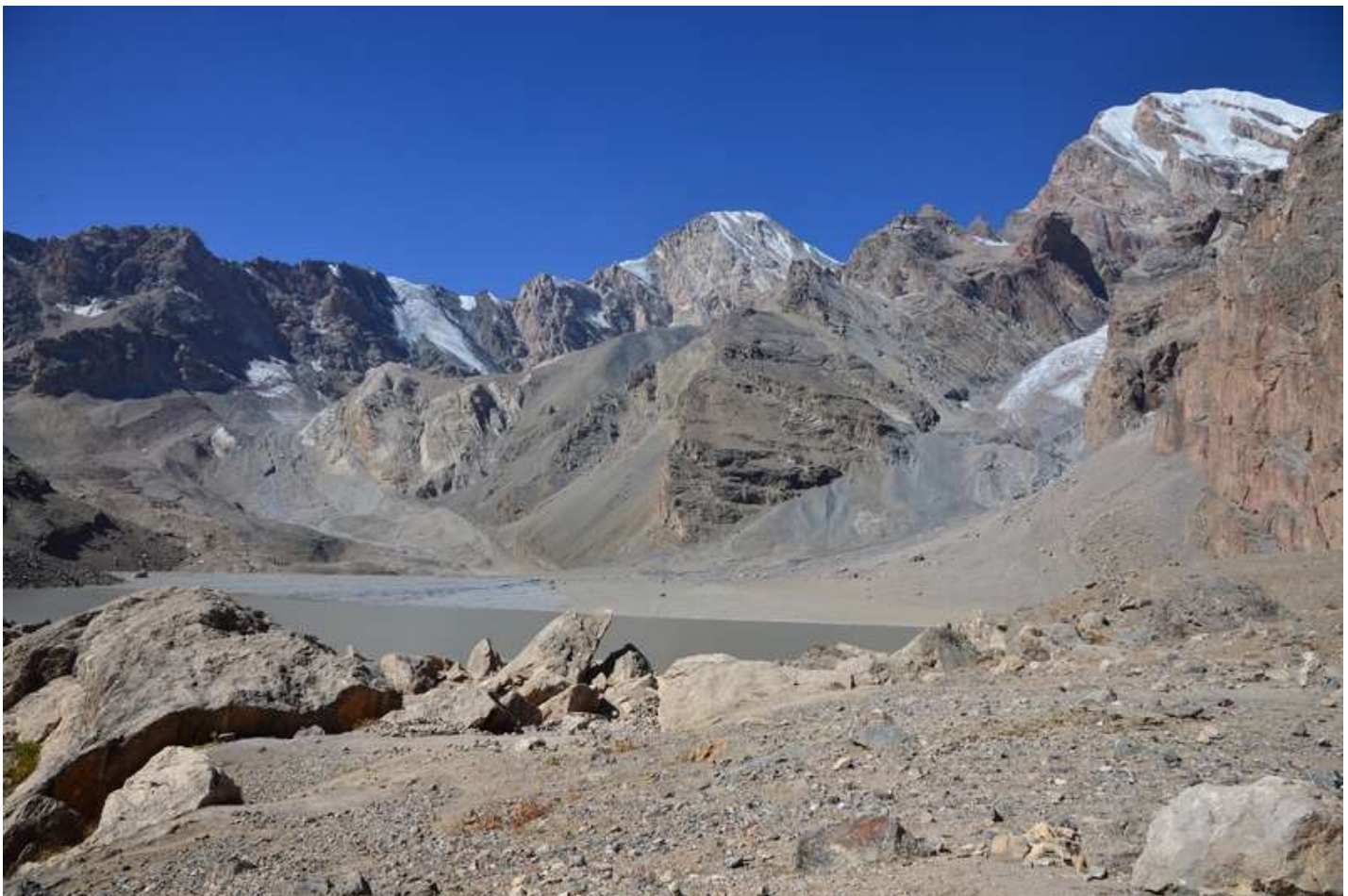
Рисунок 20 - Вид с северной оконечности Мутных озер