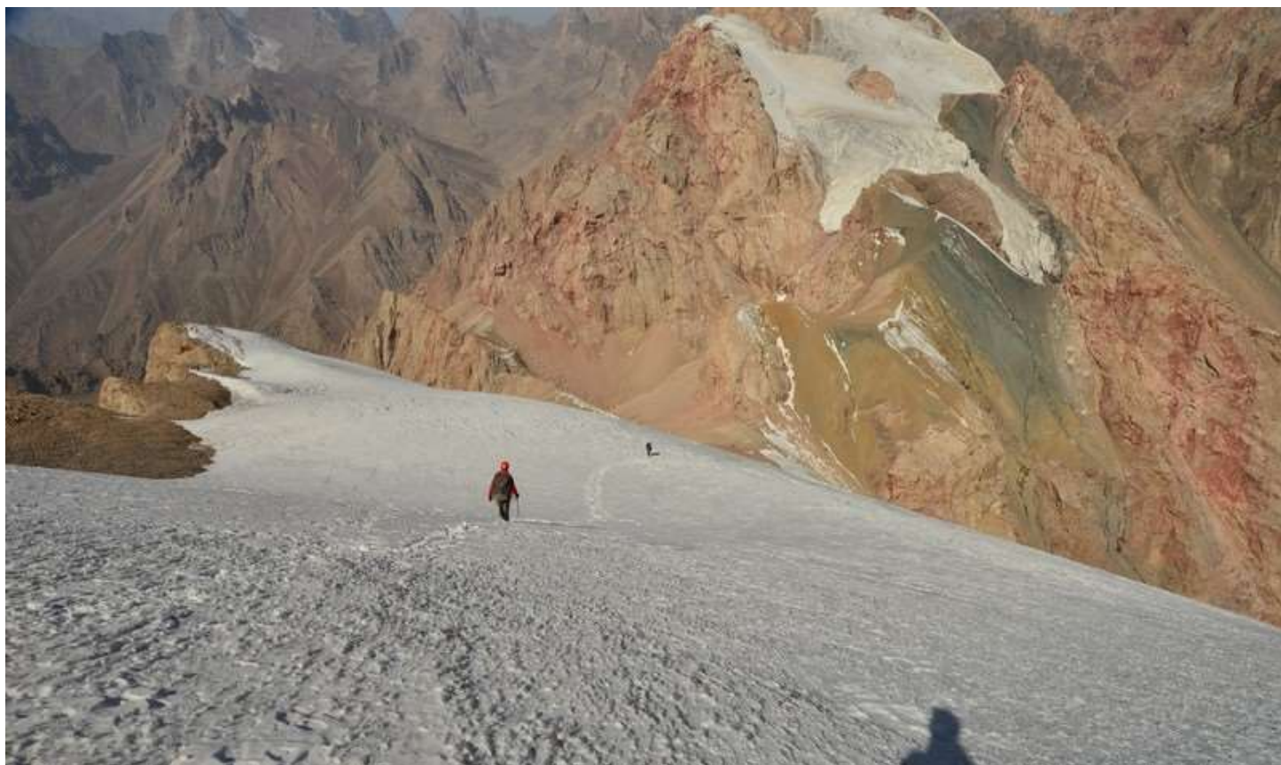
Рисунок 103 - Ледовый участок перед сыпухой