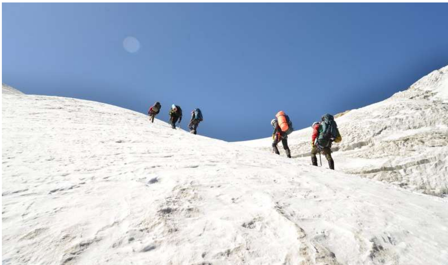
Рисунок 88 - Группа на перевальном взлете Гусева-Мухина Зап