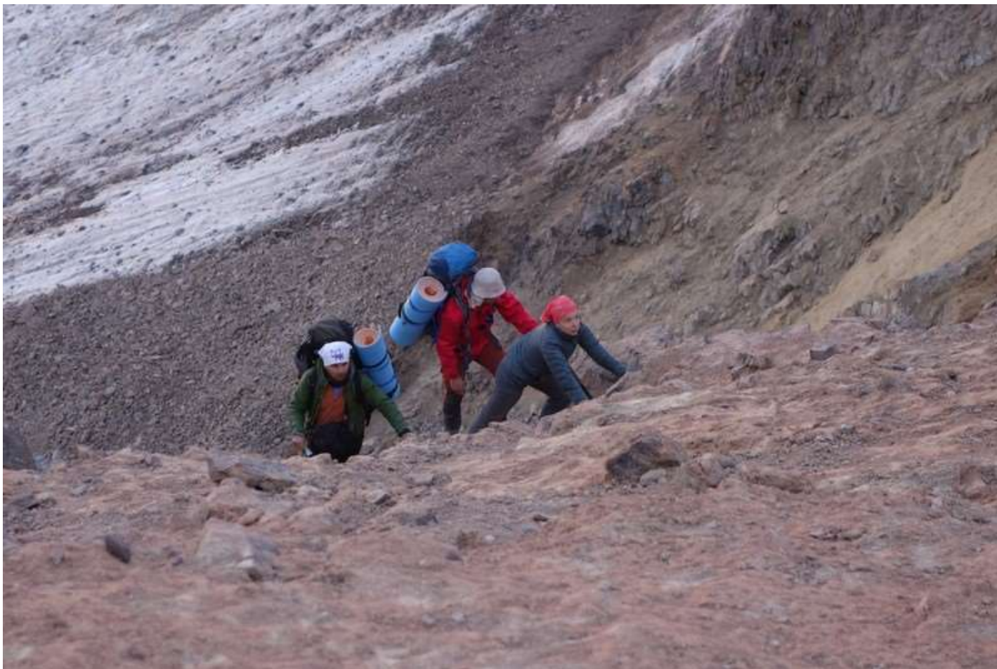
Рисунок 27- В верхней трети перевального взлета