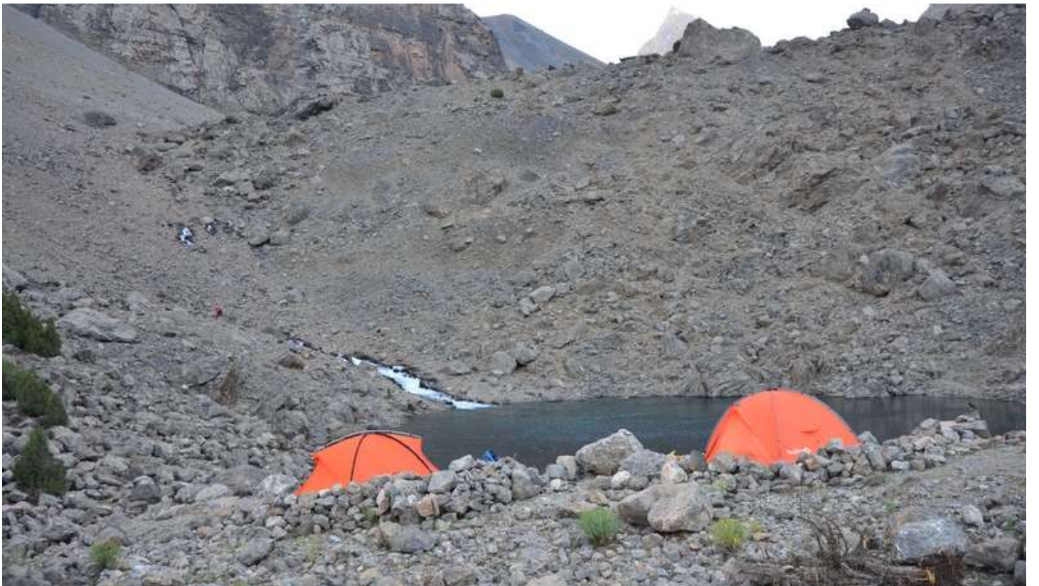
Рисунок 16 - Стоянки на оз.Пиала