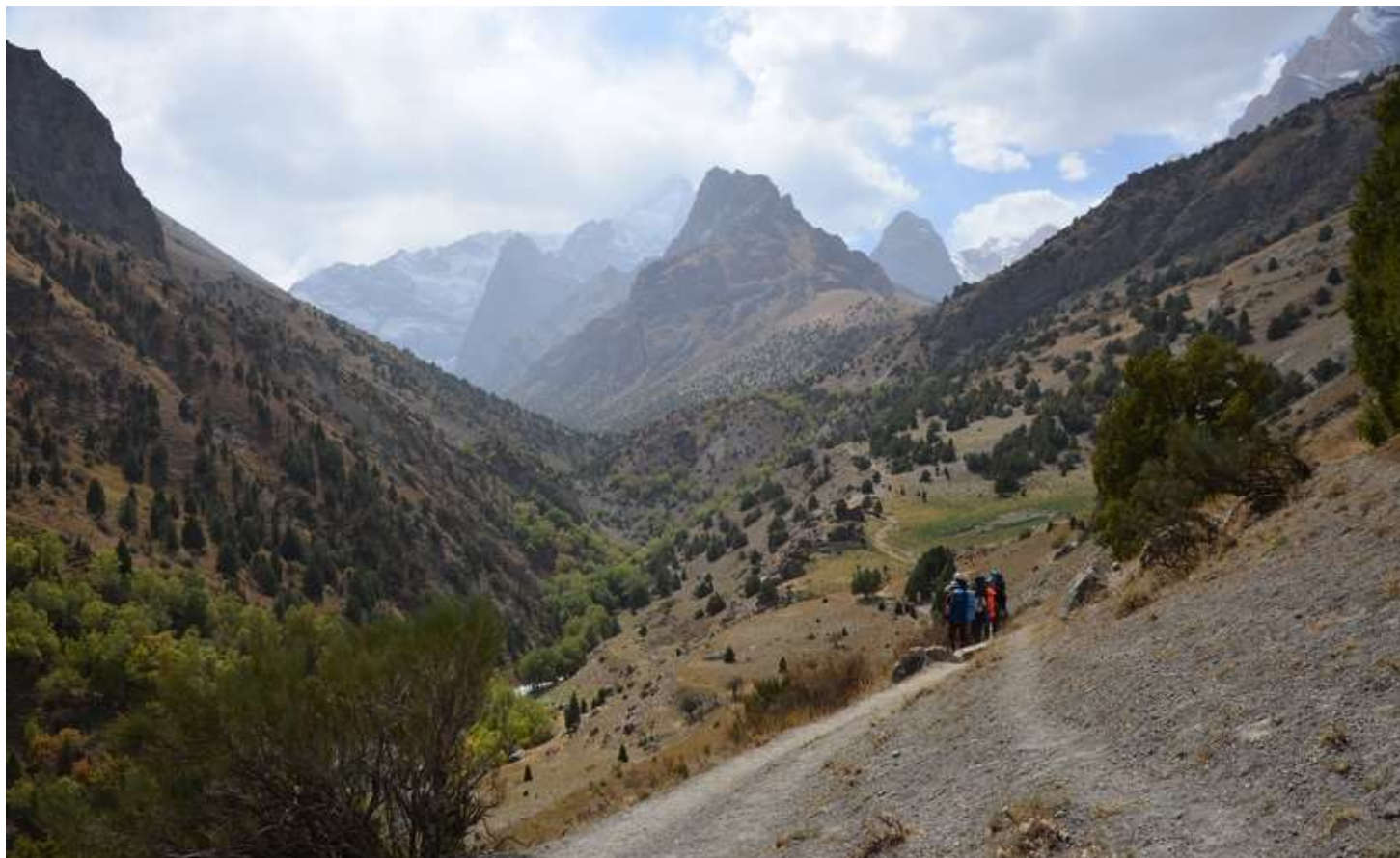
Рисунок 113 - Тропа вдоль р.Имат