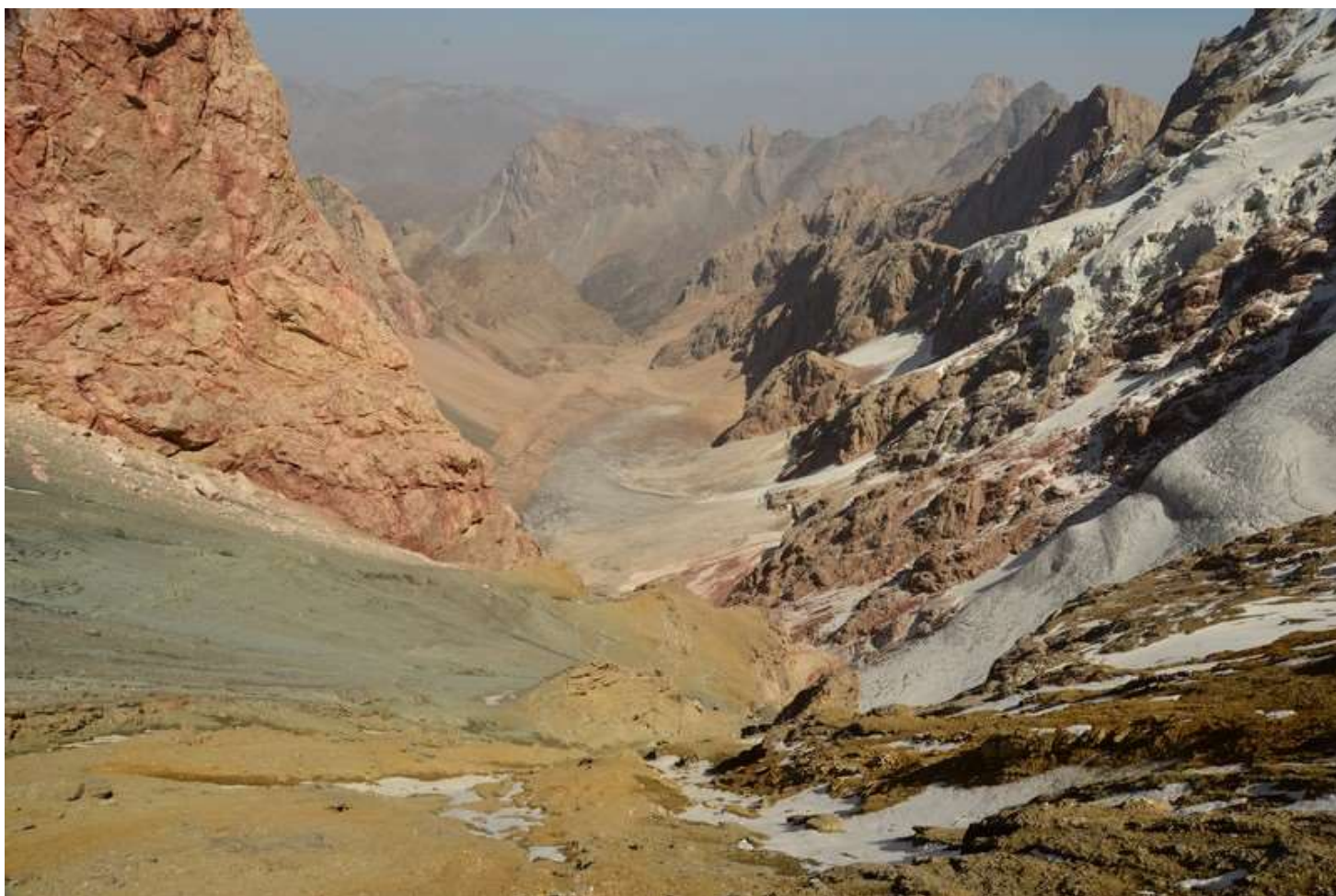
Рисунок 96 - Долина реки Желтой