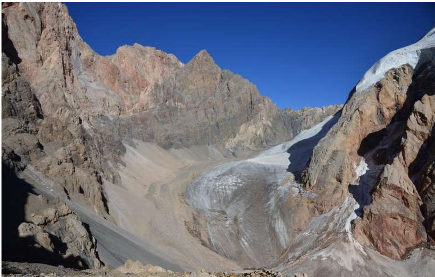
Рисунок 83 - Вид на л.Малая ганза с пер.6866. Ночевки расположены напротив ледового обвала.