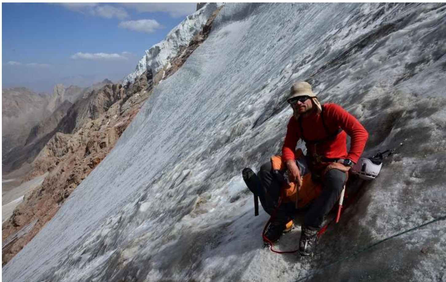
Рисунок 107 - На станции