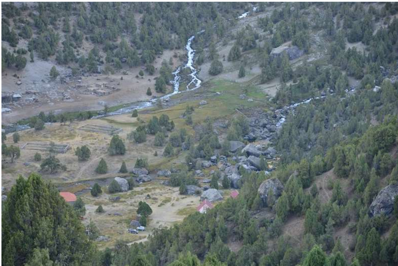
Рисунок 1 - а/л Вертикаль с начала подъема на пер. Лаудан Ложный