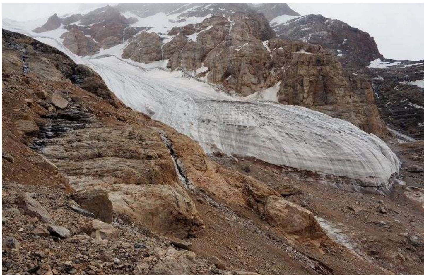
Рисунок 56 – Язык ледника Курумоч