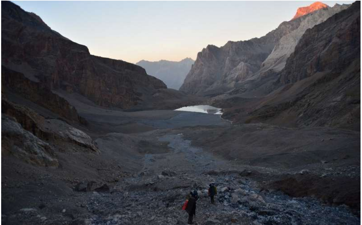
Рисунок 75 - Выход к Мутным озерам