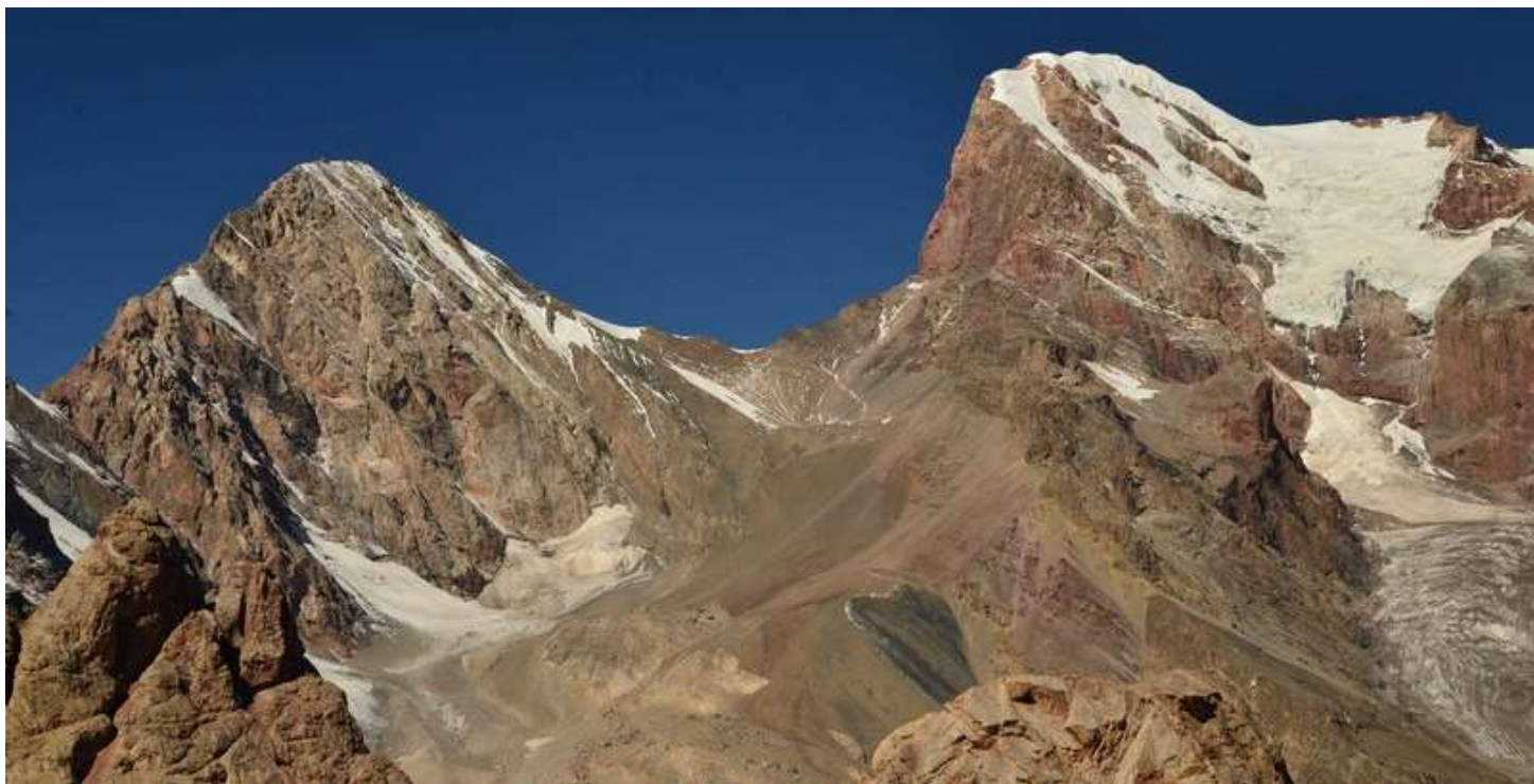
Рисунок 78 - Снежком обозначена тропа спуска с перевала Чимтарга зажатого между вершинами Чимтарга и Энергия