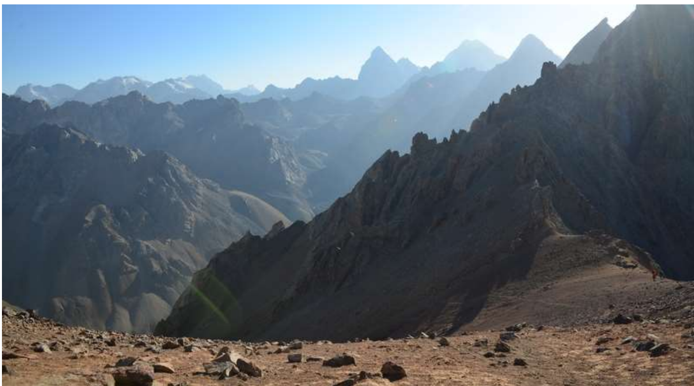
Рисунок 28 - Вид с пер. Казнок В на седловину пер. Казнок З