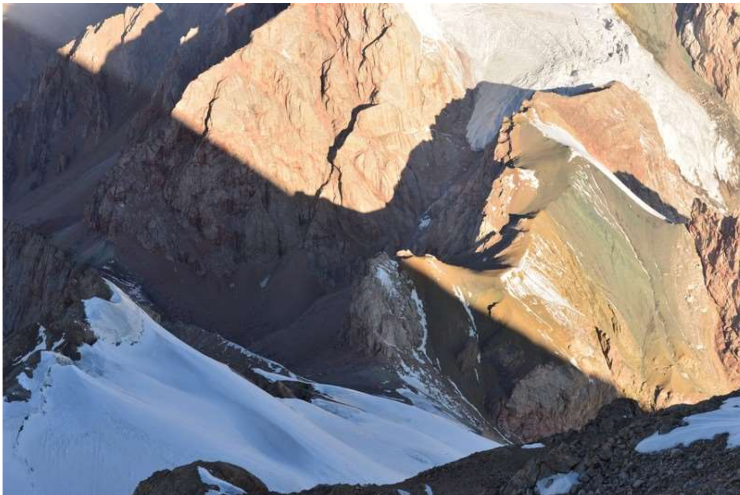
Рисунок 101 - Вид подъема на вершину