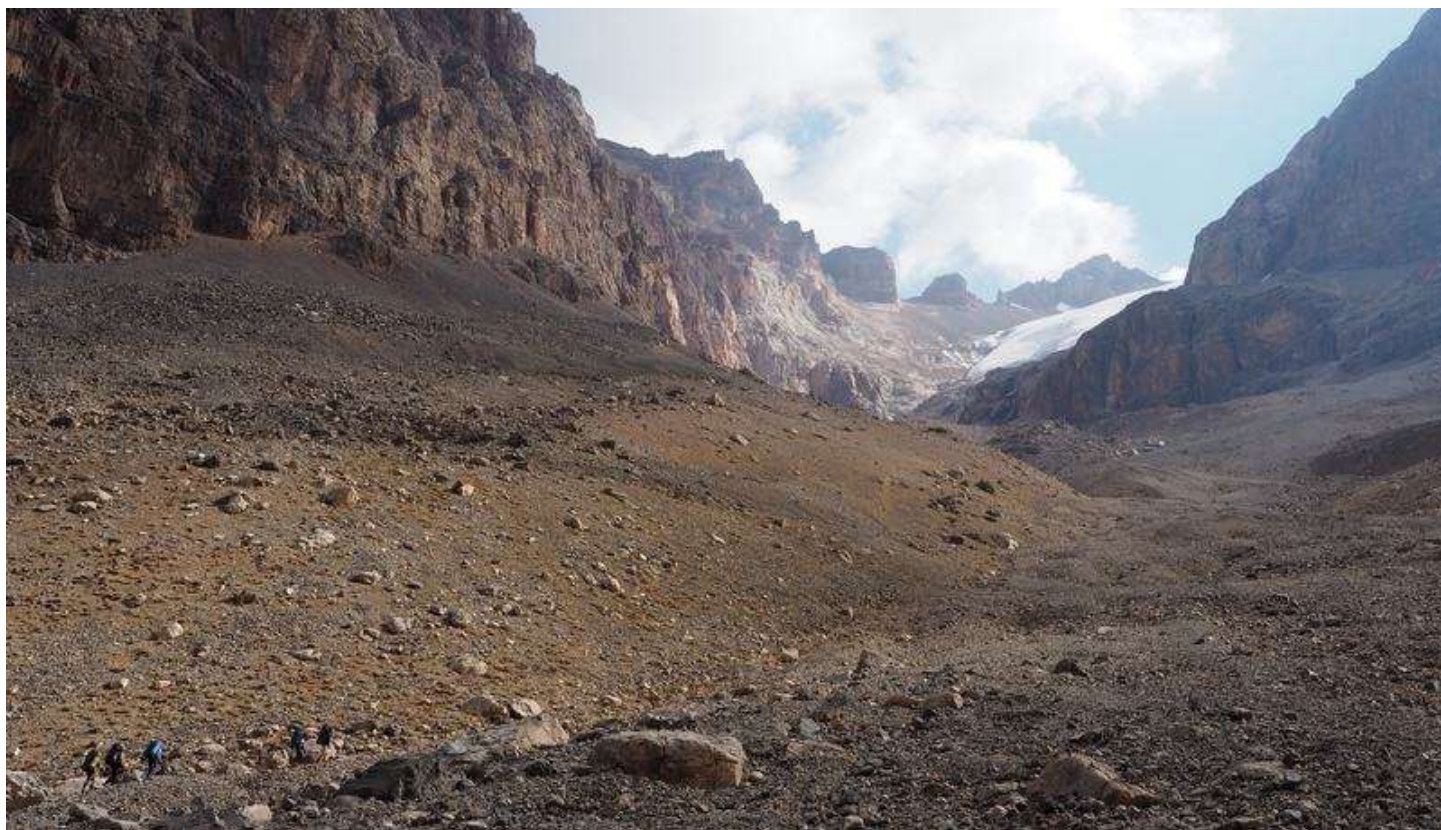
Рисунок 50 - Начало долины Курумоч. Есть теряющаяся тропа.