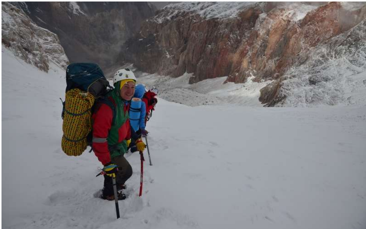
Рисунок 61 - Движение по свежавыпавшему снежку на леднике Курумоч