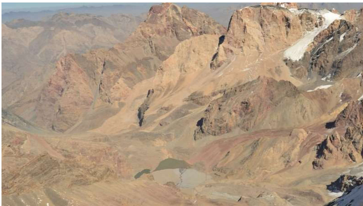
Рисунок 66 - Мутные озера с Энергии