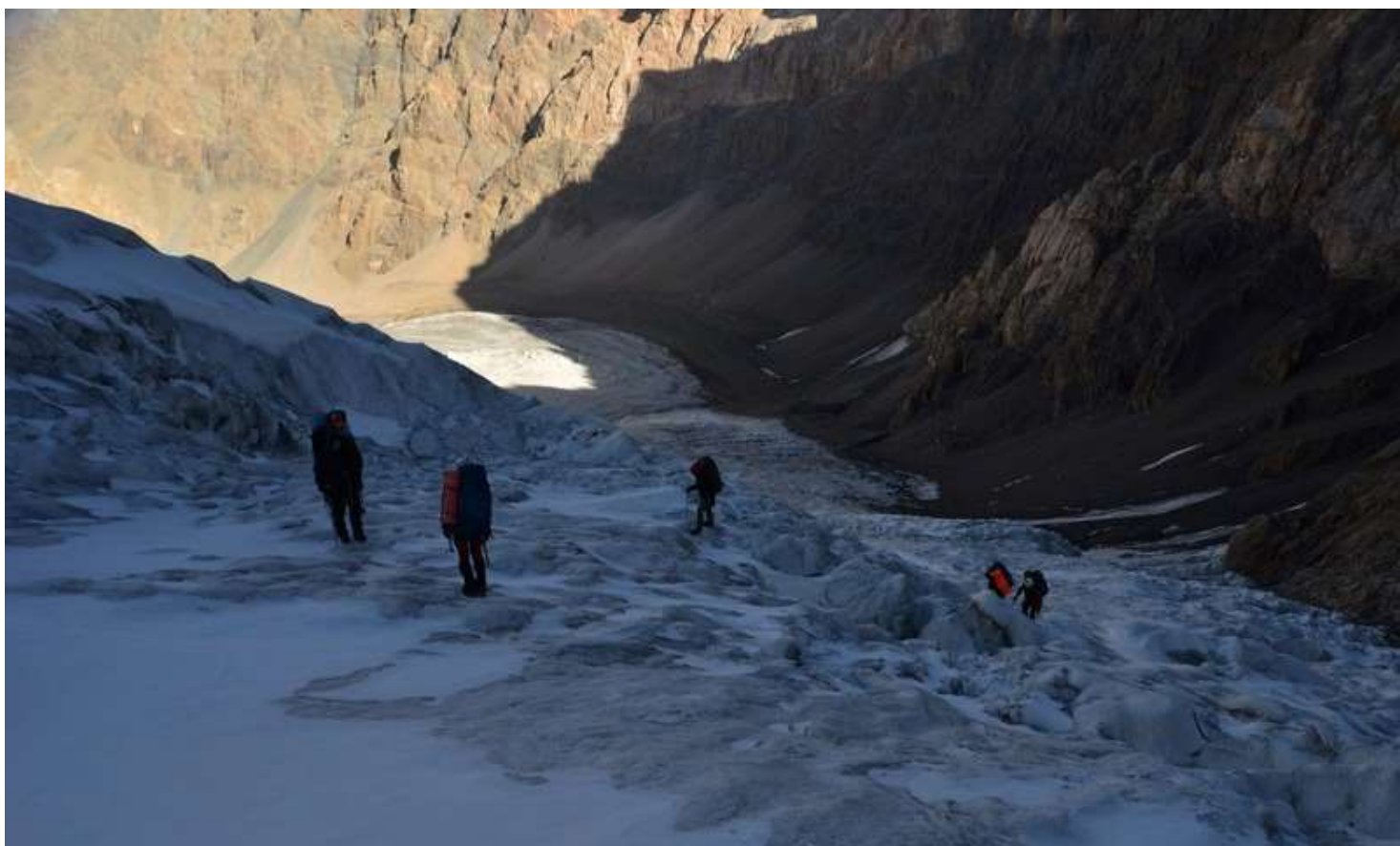
Рисунок 86 - Первая ступень л.М.Ганза

Отличительных особенностей по этому дню, относительно того, что написано в отчетах, нет, поэтому смотрим свежие фотографии и наслаждаемся видами)