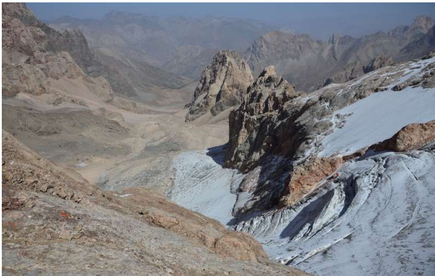
Рисунок 91 - Вид на дол.Сурхоб