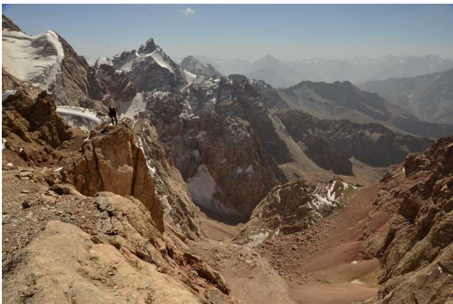
Рисунок 94 - Вид на восточный склон пер.Траверсный