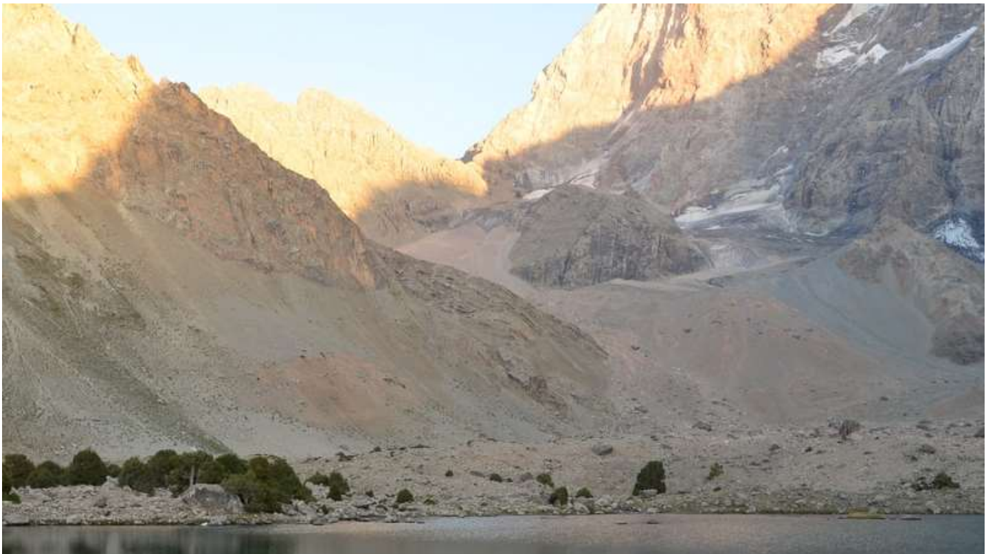
Рисунок 10 - Вид на путь подъема на пер. Адамташ