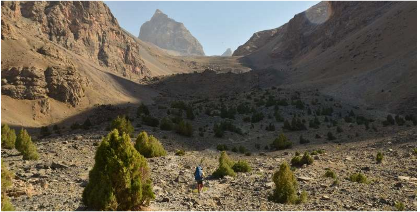
Рисунок 17 - Вид в сторону подъема к Мутным озерам, почти от Алаудинского озера