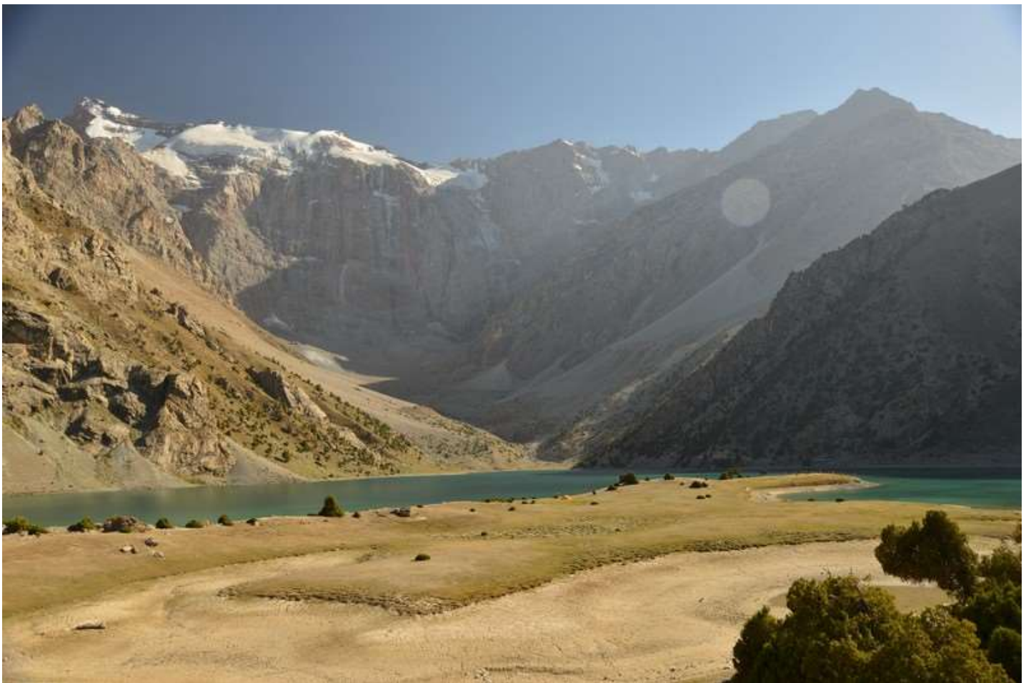
Рисунок 8 - Вид на Куликалонскую стену