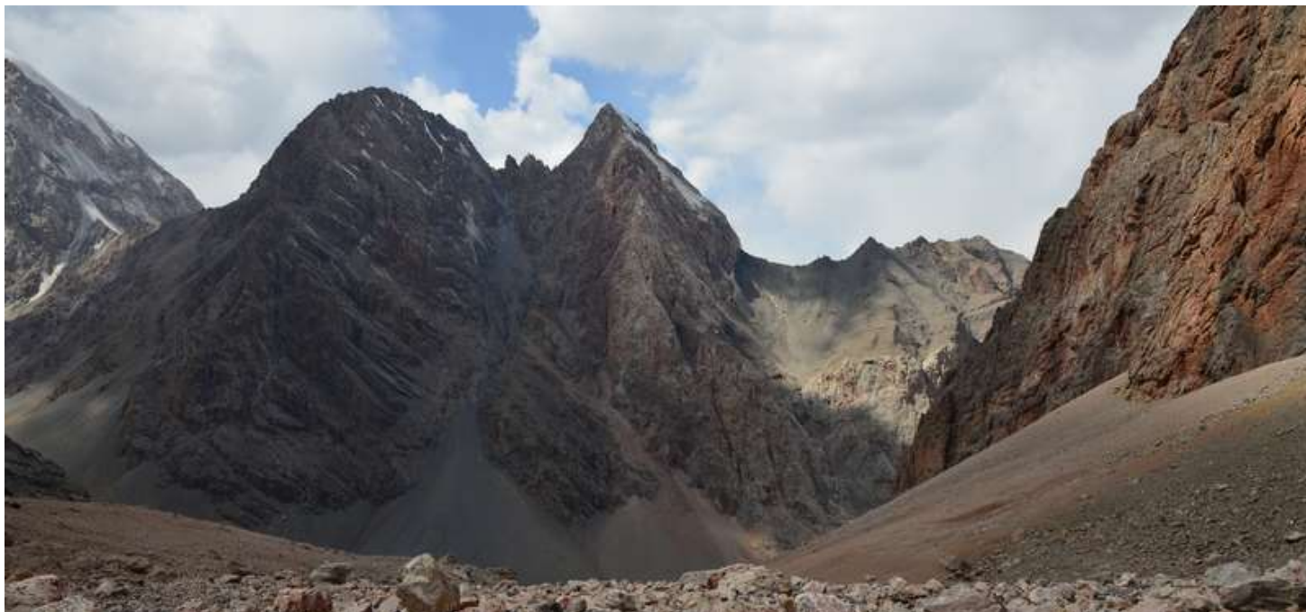
Рисунок 57 - перевалы Волжский и Сказок