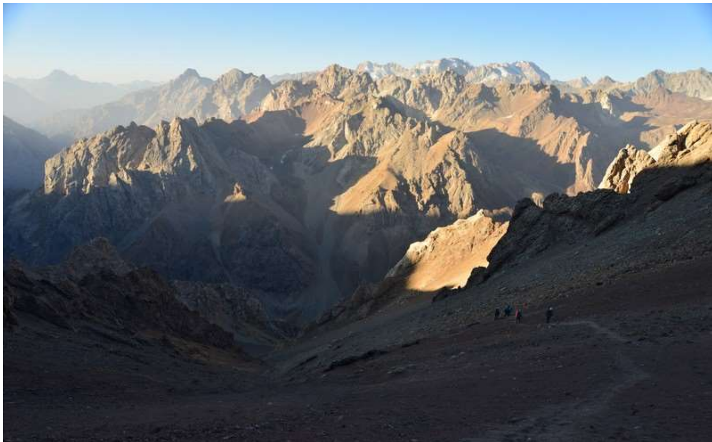
Рисунок 33 - Первые шаги на спуск с пер. Казнок 3