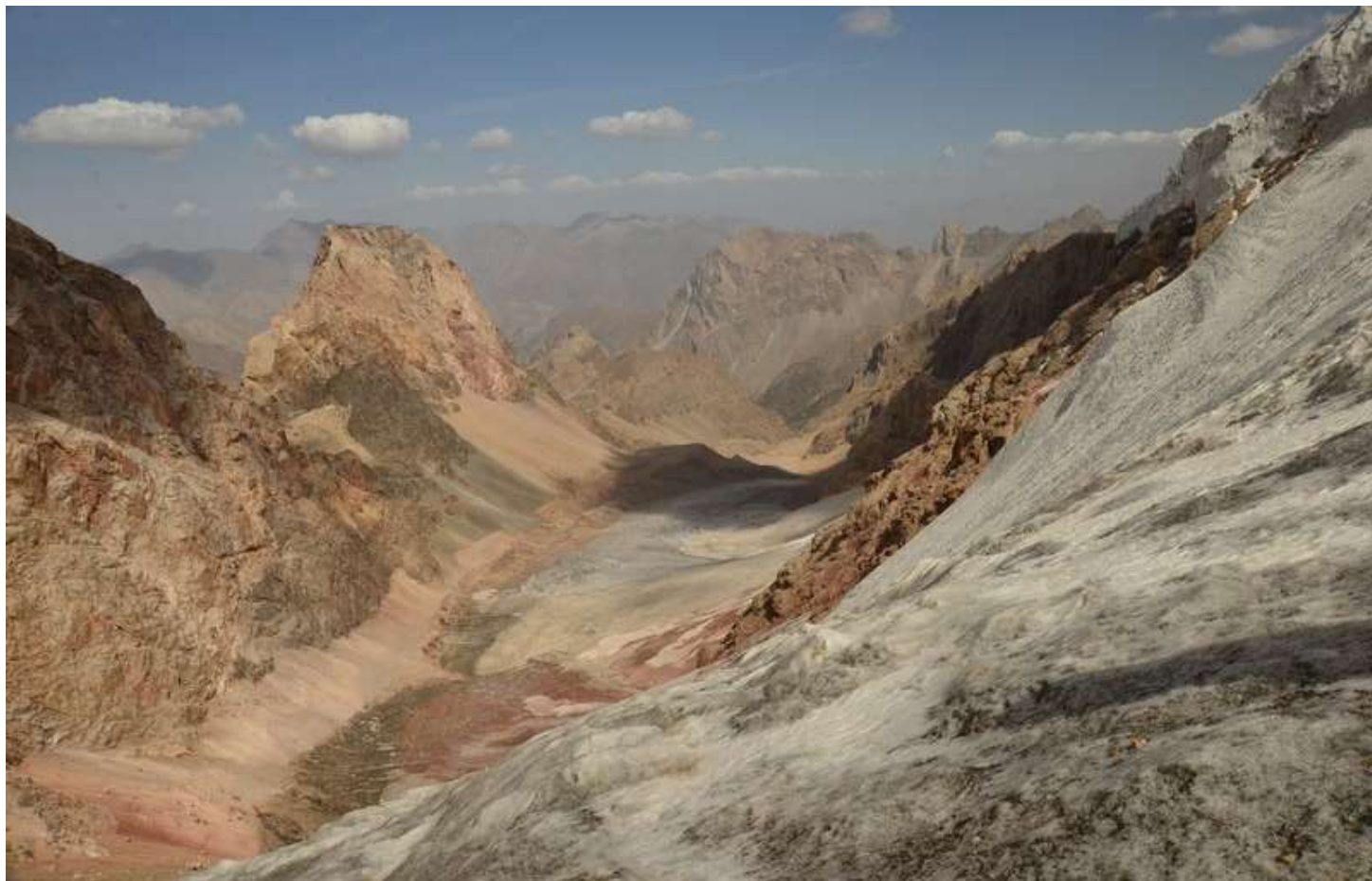
Рисунок 105 - Ледник Желтый